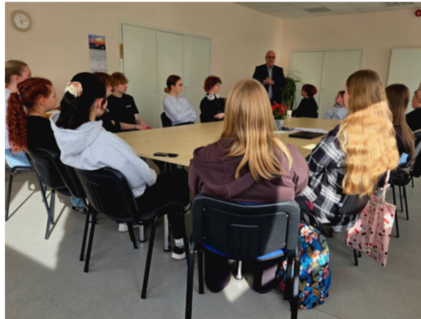
Aktiivsed valla noored kohtumisel vallavanem Einar Vallbaumiga.