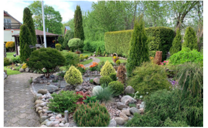
Fotod: Ene Muttika