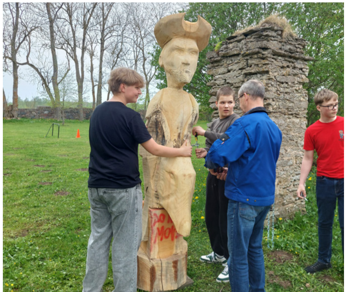
Puuskulptuuri paigaldamine.