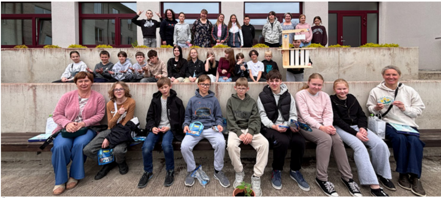
Ühine pilt Aseri ja Bikšti kooli noortest kohtumise viimasel päeval. Kahjuks ei saanud kogu grupp pildistamisel osaleda.