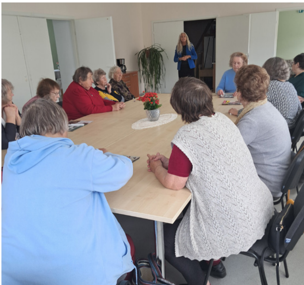
Kohtumine päevakeskuses.