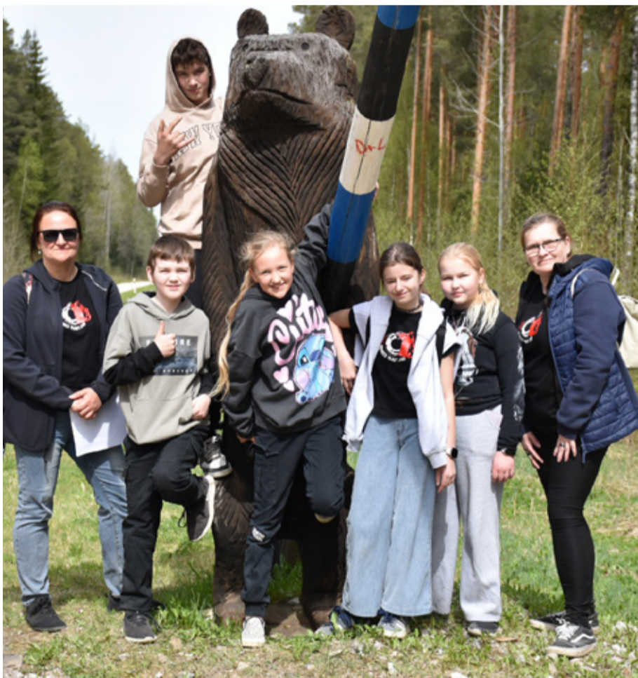
Aseri noored päästjad.

KRISTA LEPPIK, Vasta Mõisakooli huvijuht