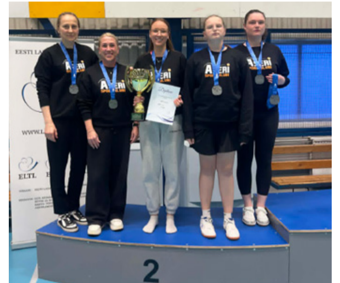
Aseri Spordiklubi lauatennisse naiskond.