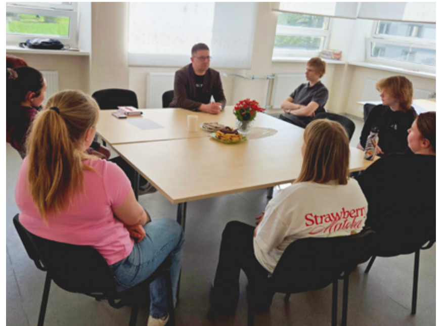
Noorte kohtumine vallavolikogu esimehe Kaido Veskiaga.