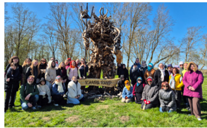
Ühispilt Kunda rannas.