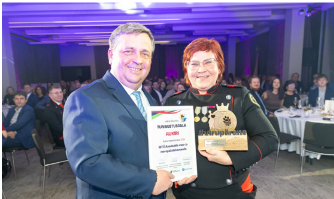
Hetk Lääne-Virumaa tunnustusürituselt.