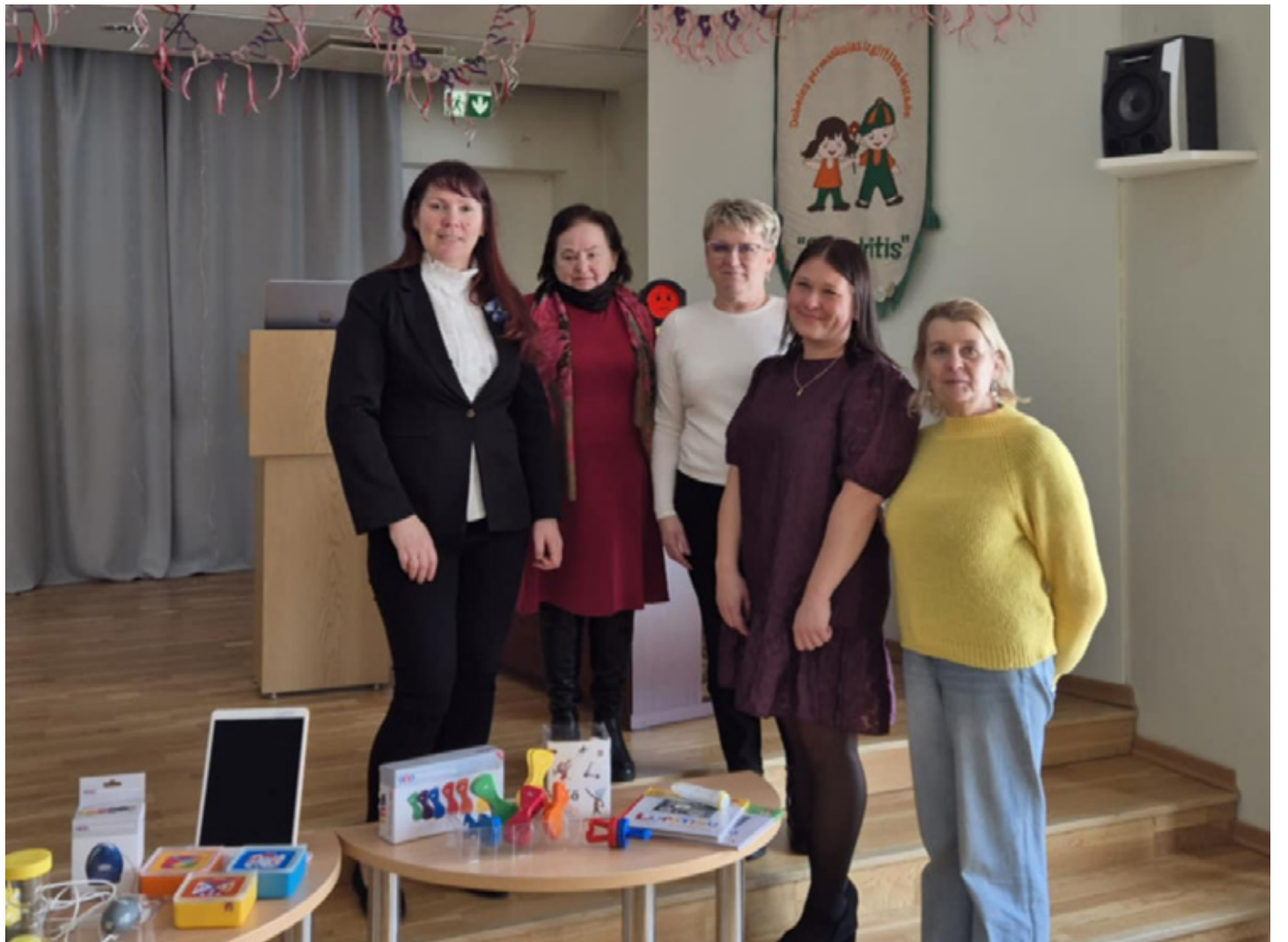
Viru-Nigula valla Lasteaed Kelluke õpetajad ja Spodritis lasteaia juhataja.