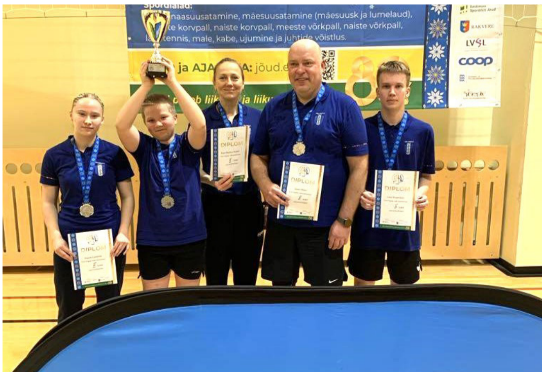
Lauatennise võistkond.

Suur tänu kõigile meie valla sportlastele, kes esindasid valla talimängudel!