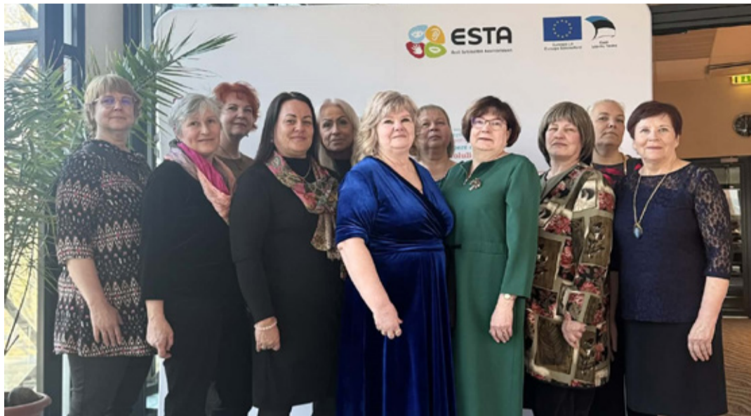
Viru-Nigula valla sotsiaaltöötajad.

Sotsiaalosakonna igapäevatöö on täis väljakutseid, mis nõuavad kiiret reageerimist ja suurt empaatiavõimet. Pidulik