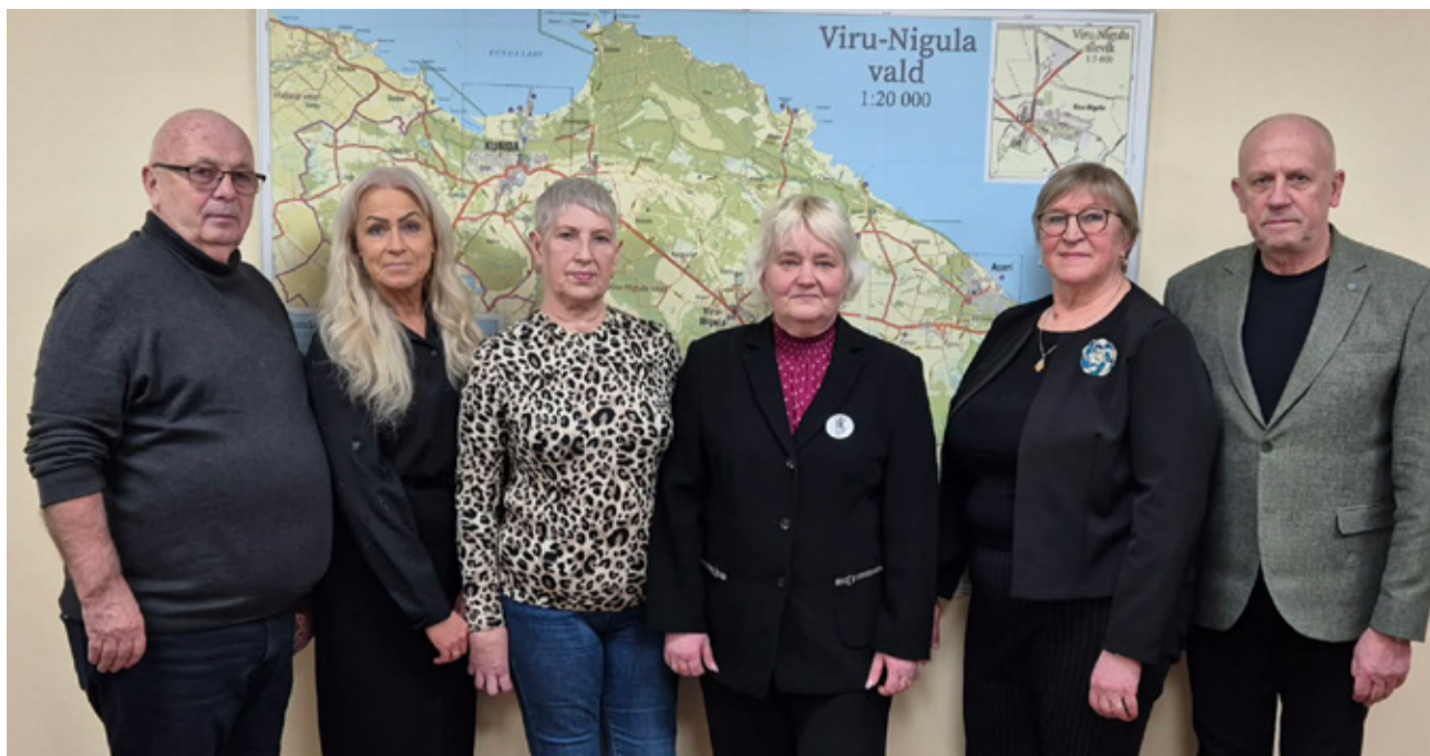
Lääne-Virumaa Puuetega Inimeste Koja esindajad ja Viru-Nigula valla esindajad