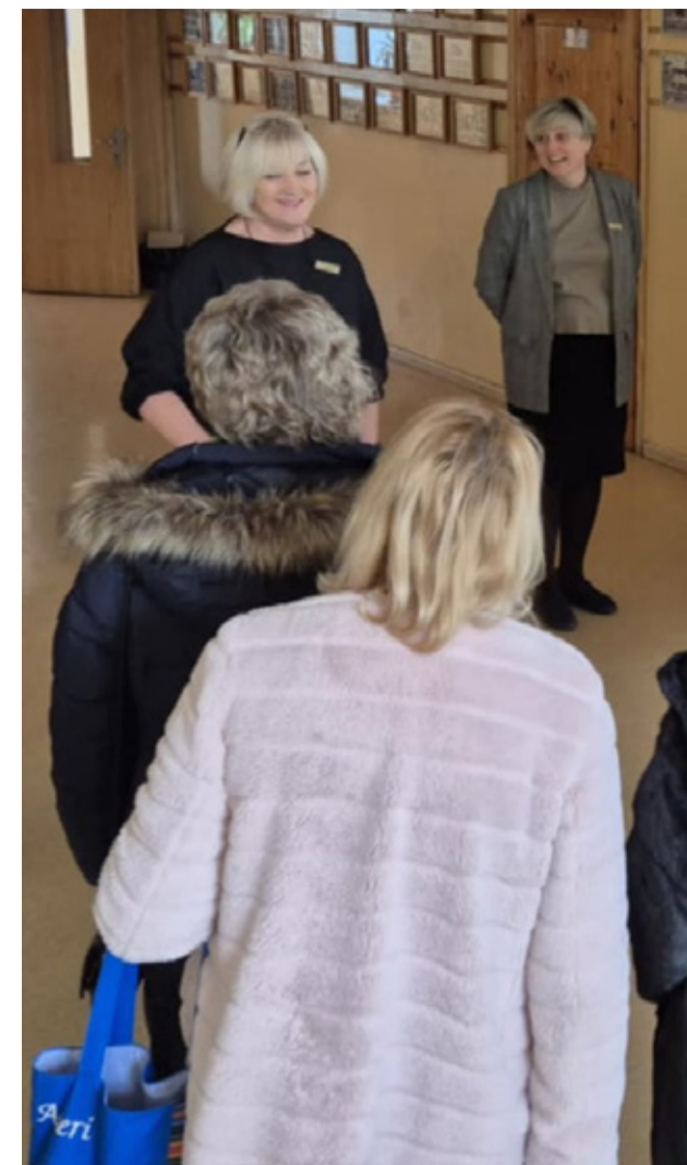
Dobele 1. Keskkooli külastus.