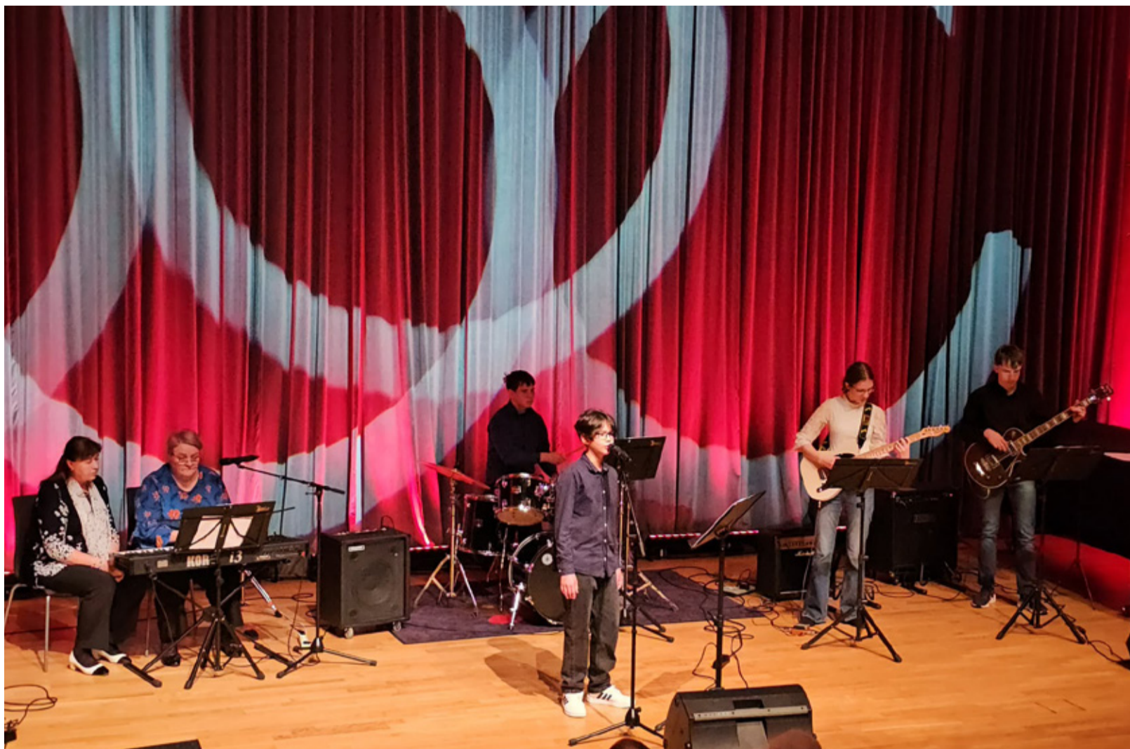
Viru-Nigula valla muusikakooli õpetajad ja õpilased.