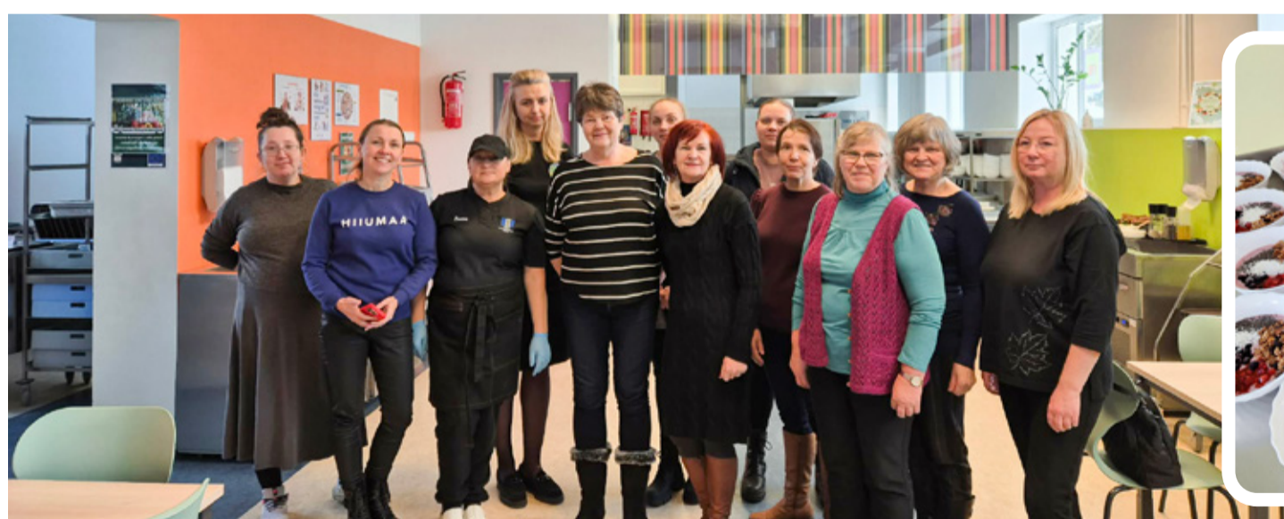
Hiiumaa kokkade delegatsiooni külastus Kunda ÜG kööki.

Hiiumaa kolleegid tundsid põhjalikku huvi meie igapäevase töökorralduse, mahe-tooraine kasutamise ning uue toitumismääruse rakendamise vastu. Uus määrus rakendus 01.09.2025 ning sellest tulenevalt on ka menüüde valik kujunenud selliseks, nagu see täna on. Etteantud köögivilja- ja puuviljakogused ning liha- ja kalakogused seavad meid kõiki uute väljakutsete ette ning nõuavad väga teadlikku menüü planeerimist. Oleme viimastel