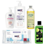
Kehahooldus ja põetusravimid