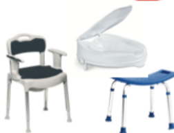
Wc ja vannituba