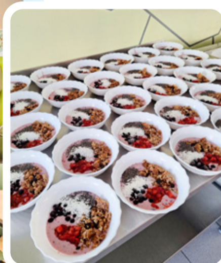
Koolilõuna Aseri koolis

Eraldi töin tutvustuses esile ka meie valla köökide väga tu-