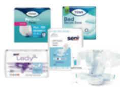
Mähkmed ja imavad tooted