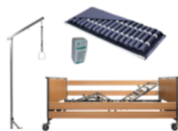
Hooldusvoodid ja lamatiste ennetamine