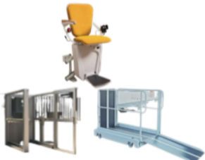
Kodus ja avalikes ruumides