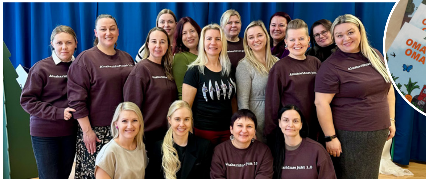
Alushariduse juhtide talveseminaril osalejad.

6. jaanuaril külastasid külalised Moldovast Viru-Nigula valla lasteaed Kelluke Kunda ja Aseri maja, kellele tutvustati lasteaiatöökorraldust, süsteeme ja igapäevast toimimist. Ühises