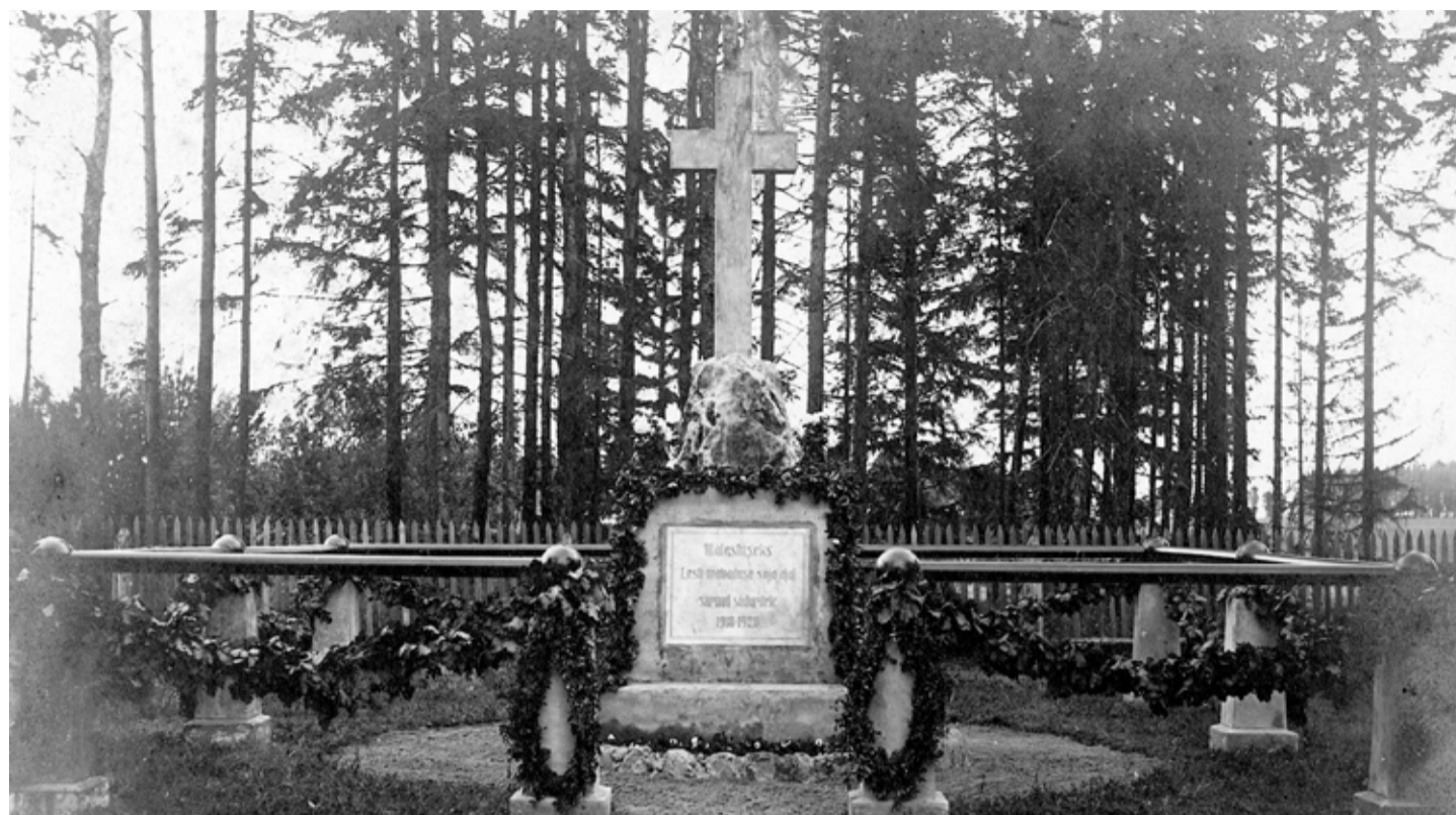
Vabadussõjas surnud sõdurite mälestussammas Kunda sõjaväekalmistul

Tsemendivabrikule kuulunud koolimajas ja elumajas alustas niisiis juba 2. veebruar