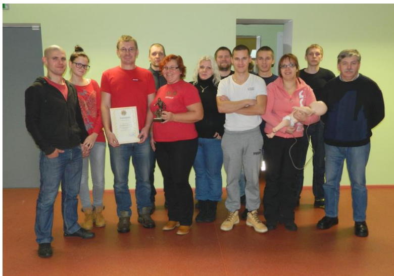
Fotol: Elupäästva esmaabi koolitus novembris 2014

Mitteametlik külastus möödus väga meeldivas õhkkonnas. Külalised olid lahked abi ja näpunäiteid jagama, et komando tõrgeteta toimima saada. Veebruaris leidis aset ka veel teine oluline sündmus. Nimelt