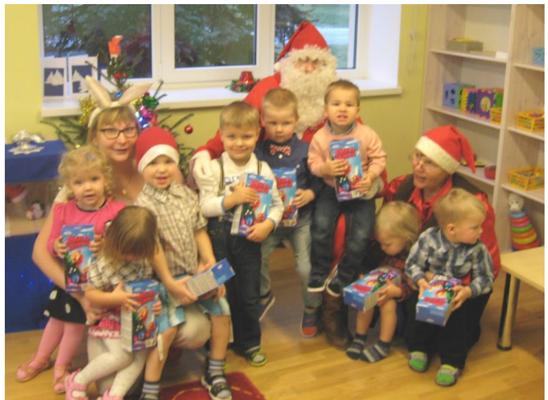
„Jänkude“ rühma jõulupidu

18.detsembril toimus koolis jõululõuna ning väike aktus ja filmikoolitusel valminud filmide vaatamine. Aktusel tänati õpilasi, kes Robotexi digitaaljoonistuskonkursil suurepäraselt esinesid. Samuti tänati ka õpilasi, kes filmikoolitusel aktiivselt osalesid. Sama päeva hommikupoolikul külastas Jõuluvana lasteaia "Jänkude" rühma ning õhtupoolikul oli lasteaia saalist saanud "Päkapikkude kool". Ka "direktor Jõuluvana" jõudis õigel ajal kohale ja väikesed päkapikud tundsid suurt rõõmu kommi-pakkide üle.