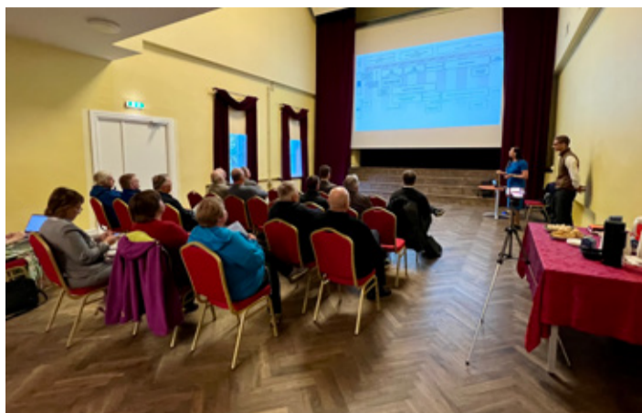
Fermi Energia infotund Kunda linna klubis.

Riigi eriplaneeringu esimeses etapis toimub tuumajaama