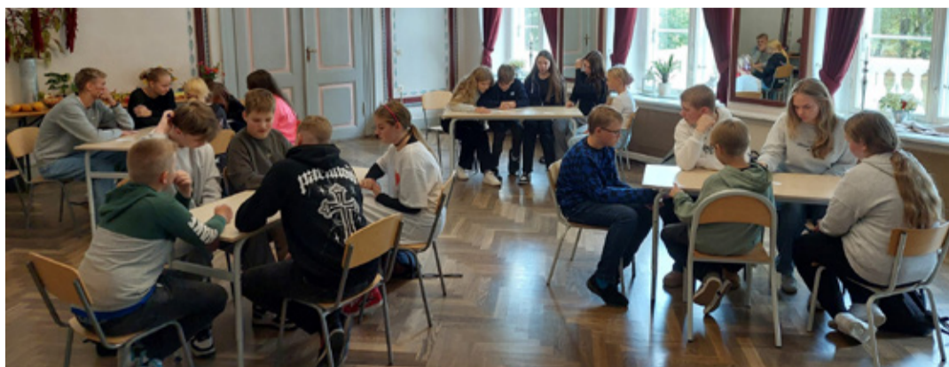
Rahvusvahelist muusikapäeva tähistasime muusikateemalise mälumänguga.