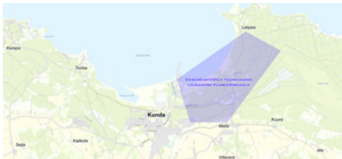
Ligikaudne planeeringuala Viru-Nigula vallas.

võimalike asukohtade põhjalik uurimine, mis kestab tõenäoliselt 2028. aastani. „Oleme läbi viinud põhjaliku eeltöö ning tutvustanud planeeringualad nii Lüganuse kui Viru-Nigula vallas, kust sobilikke asu-