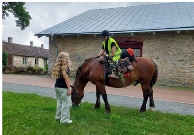
21. juulil võõrustati Vasta mõisas teiste seas Herra Hobust Johannaga.