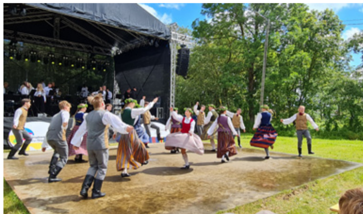
Esineb noorte tantsurühm Dobelest.