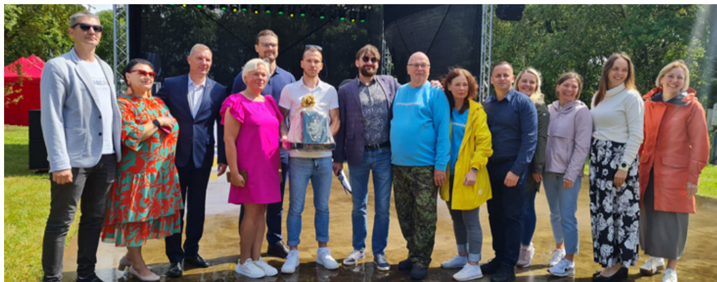
Mere- ja perepäeval võõrustasime külalisi Lätist Dobelest ja Leedust Akmenest.