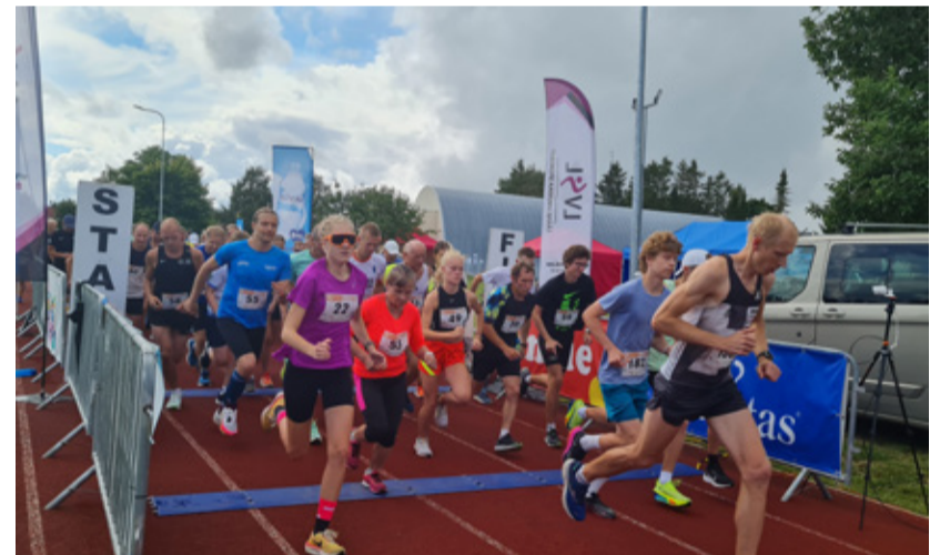
Vaatamata heitlikule ilmale startis põhijooksule koguni 90 jooksusõbra.

600 m lastejooksu võitsid oma vanuseklassides edukaimad noormees-est Jegor Andrejev (M12) ja Kaspar Puurmeister (M14) ning neidudest