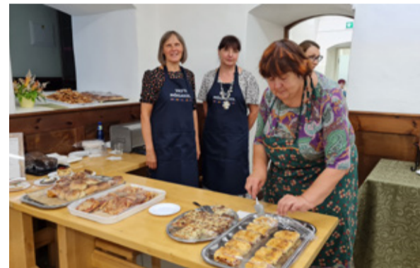
Vasta Kooli tublide kokkade meeskond.