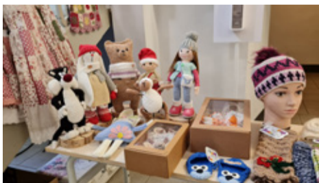
Mõisa külastajad said kaasa osta Lilleoru Talu ilmelist käsitööd.