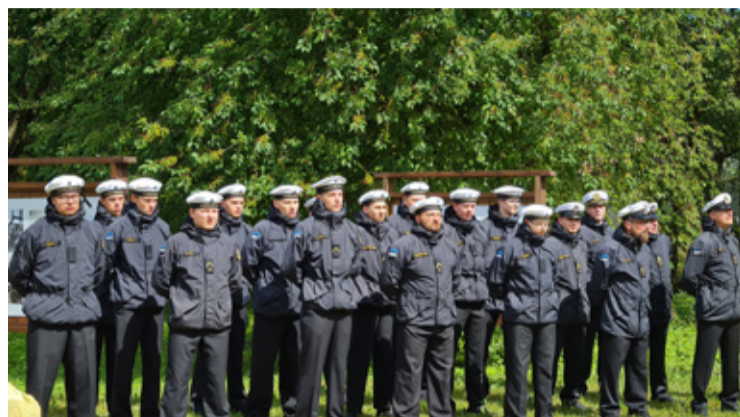
Sõpruslaeva Wambola meeskond mere- ja perepäeva avamisel.