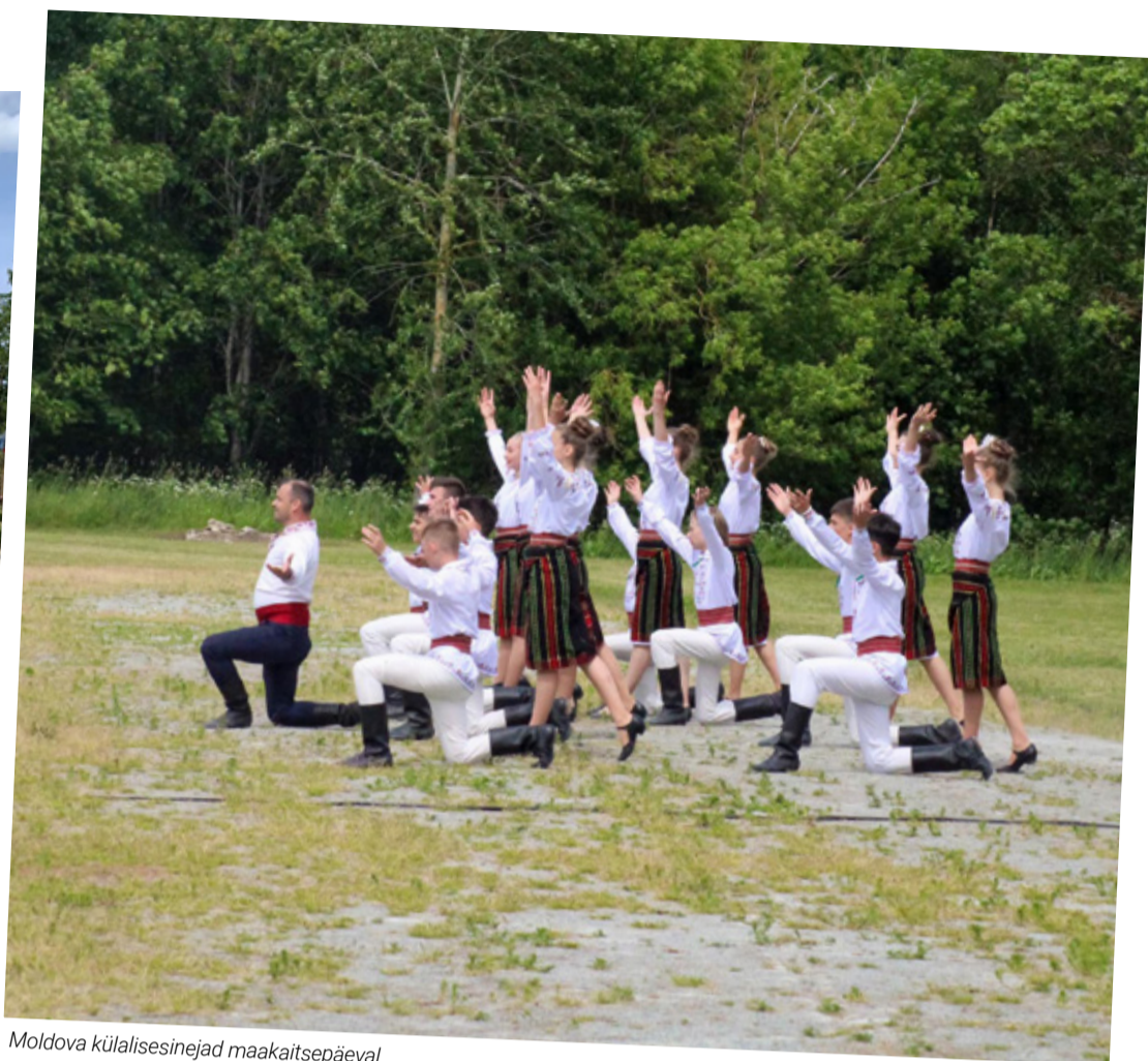
Moldova külalisesinejad maakaitsepäeval