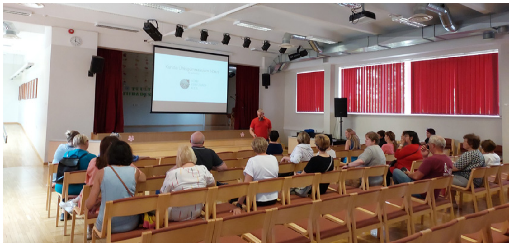
Kunda kooli õpetajad Võru Kreutzwaldi koolis külas.