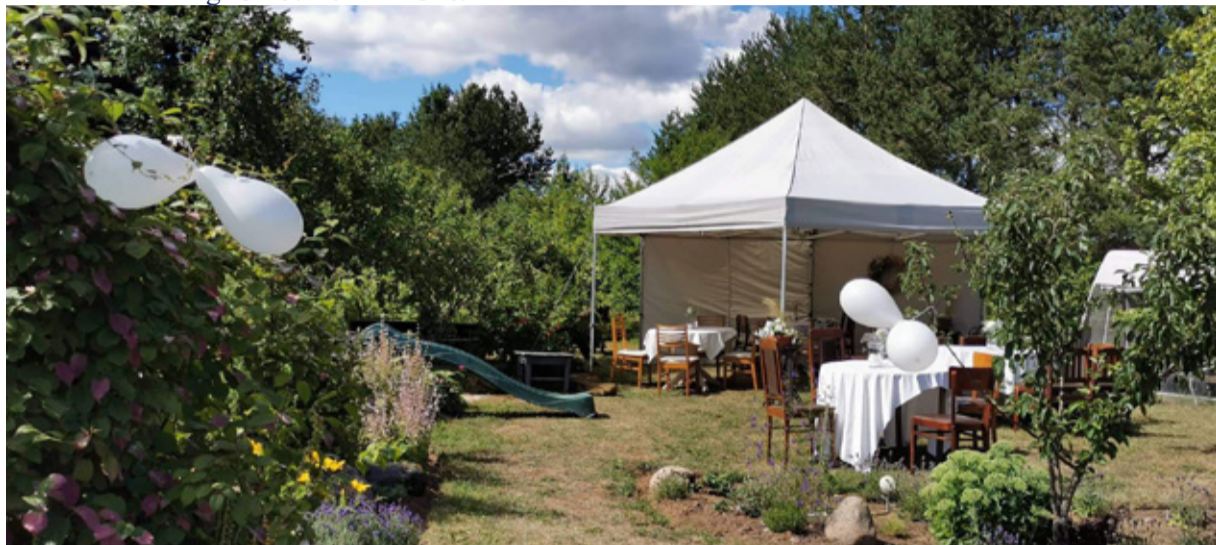
Resto Valge Pärl.

Elanike arv seisuga 31.07.2022 on 5709 inimest.