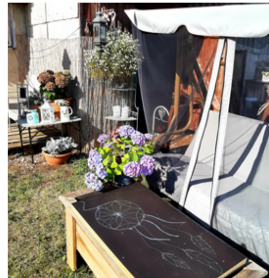
Kristeli Lauda kohvik.