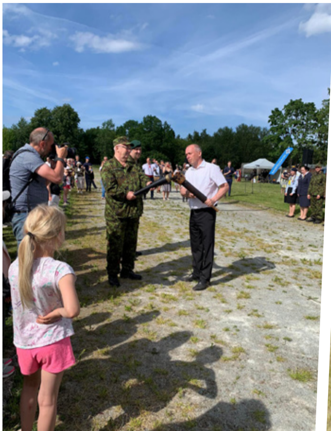
Tule jagamine maakaitsepäeval