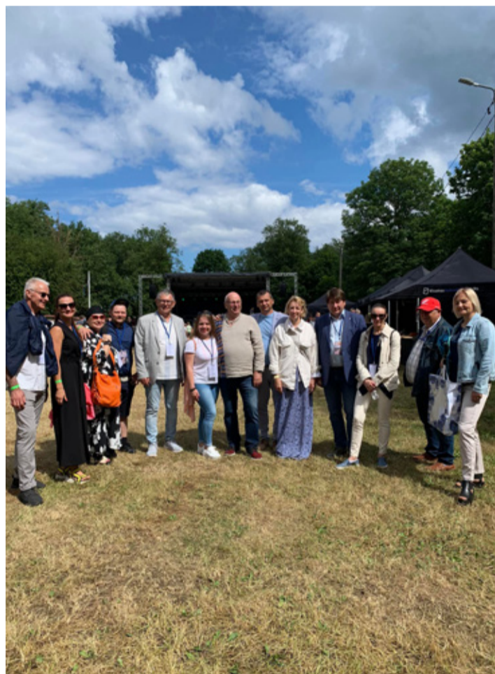
Väliskülalised Mere- ja perepäeval

9. juulil leidis aset järjekordne Kunda mere- ja perepäev, seekord juba 22. korda. Nii nagu tavaliselt, toimus ka seekord rannas laht ning Kunda sadam oli küllastajatele avatud. Huvilised said vaadata sadama tehnikat ning külastada laeva Wambola.