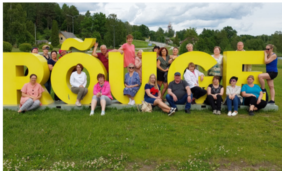
Kunda kooli õpetajad väljasõidul.