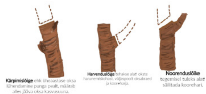
Kärpimis lõige ehk üheaastase oksa lühendamise punga pealt, määrab alles jääva oksa kasvusuuna. Harvendus lõige tehakse alati oksa harunemis kohas, väljaspoolt oksakraed ja kooreharja. Noorendus lõige tegemisel tuleks alati sõilitada koorehari.