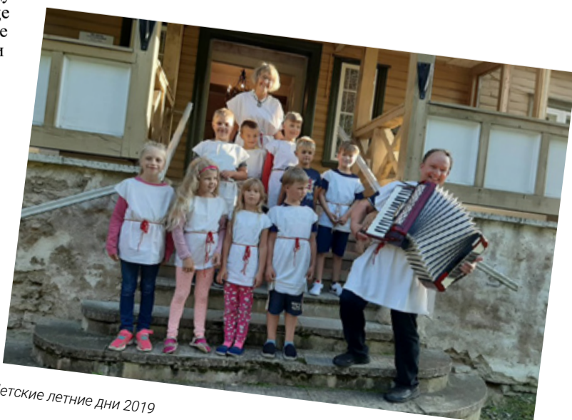
Детские летние дни 2019