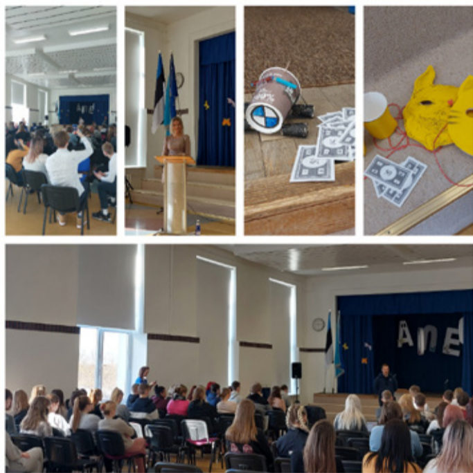
Уездный день предпринимательства.

Эвели Пресс Кундаская Общ. Гимназия Учитель по предпринимательству