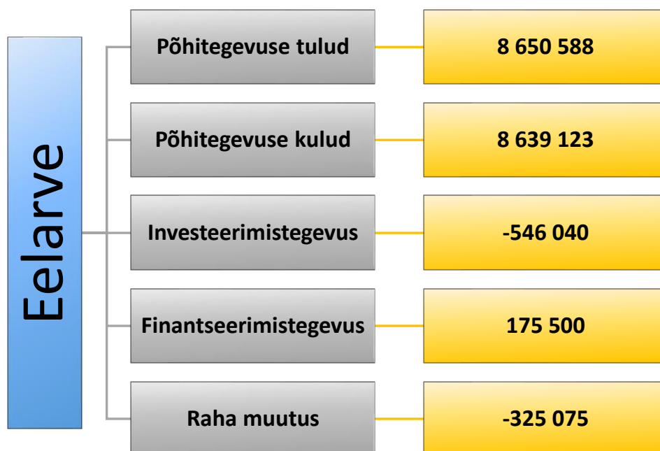
Joonis 1. Ülevaade Viru-Nigula valla 2022. aasta eelarvest.

Ülevaade Viru-Nigula valla 2022. aasta eelarvest on alljärgneval joonisel: