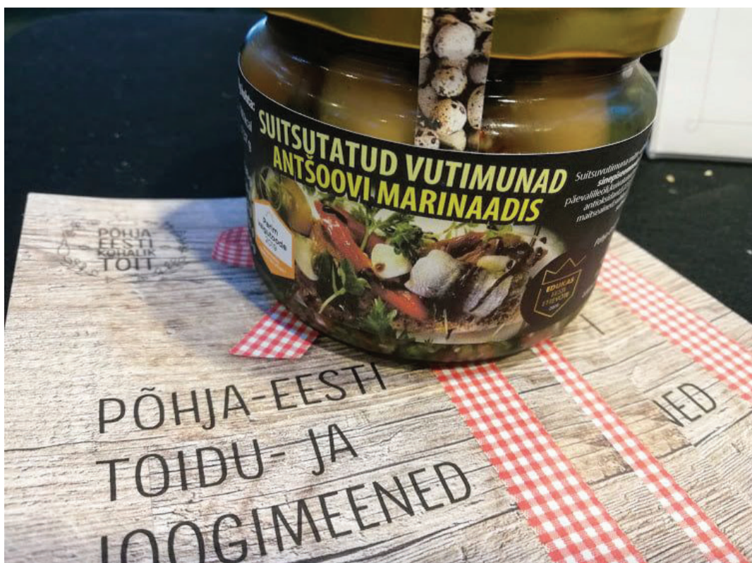
Põhja-Eesti toidumeene tiitliga pärjatud Suitsutatud Vutimunad Anšoovises.