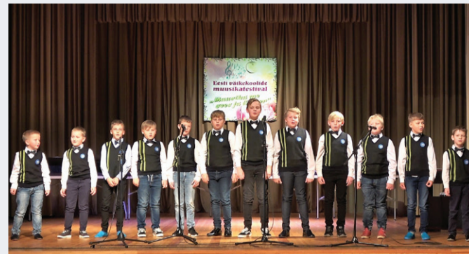
Vasta Kooli poistekoor esinemas.