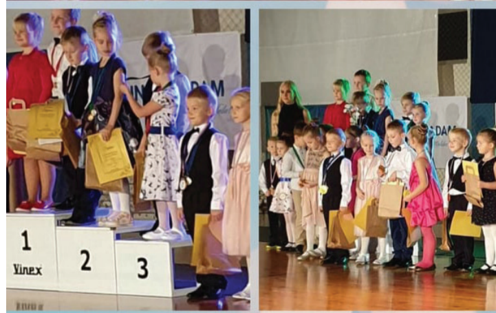
Fotod ja kollaažid: Elle Türkel