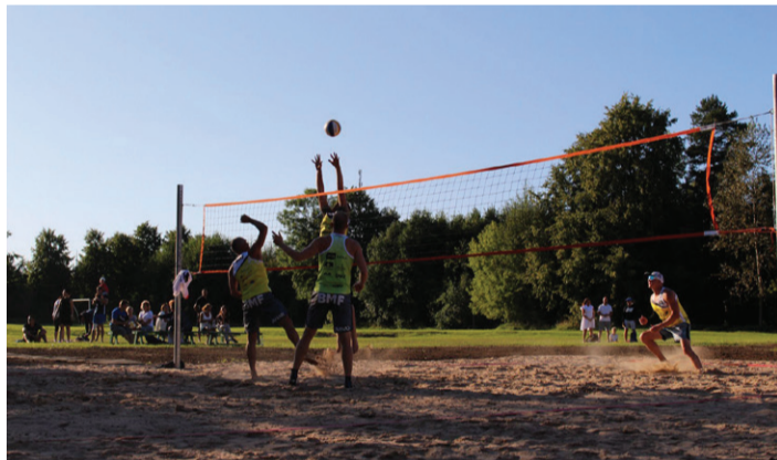
Galerii: virumaateataja.postimees.ee/7043536/vorratu-vorkpalliga-avati-aseri-vollevaljak.

Viru-Nigula rannavolle suveturniir külastas sel aastal erinevaid valla rannavolleväljakuid. Soovisime elanikele tutvustada valla spordirajatisi ja rannavolle mängimise võimalusi. Etappide korraldamise positiivse mõjuna said mitmed väljakud paremasse seisukorda. Turniir sai alguse Mahu rannas ning liikus edasi Kunda ja Kalvi randa. Neljanda etapina võõrustas meid Lammasmäe puhkekeskus ning finaaletapiks saime valmis uue Aseri vabaajakeskuse väljaku Aseri staadioni kõrval. Turniirilt võtsid osa peamiselt meie valla harrastajad ja nende sõbrad-tuttavad. Keskmiselt osales etappidel kaheksa paari. Paaristurniiri esimesed kolm etappi võitis rannavollel tõsisemalt harjutavad noorte neidude võistkond GK Ehitus. Võistkonnas mängisid 5 etapi jooksul