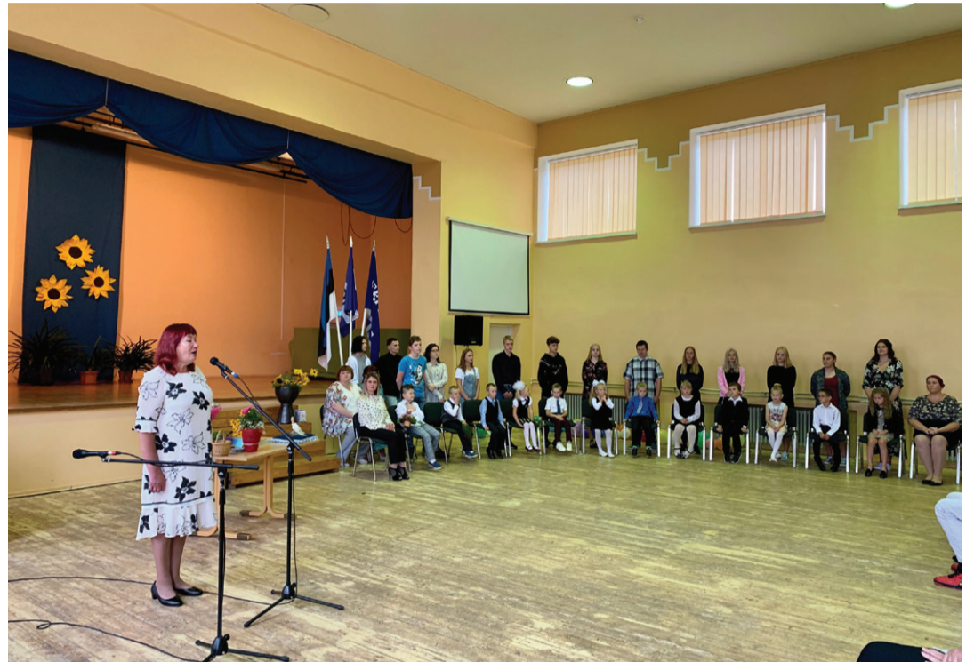
Aseri kooli esimene klass.