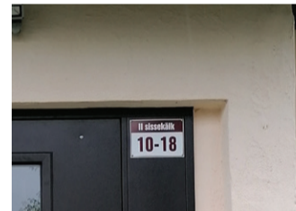
Üks võimalus trepikojas asuvate korterite numbrite kajastamiseks.

Viru-Nigula valla heakorra eeskirja § 7 lg 1 p 5 kohustab kinnistu ja hoone omanikku tagama vastavalt hoonete ja korterite numeratsioonile õige numbrimärgi olemasolu korteri uksele ning hoonetänavapoolsel seinal või kinnistu piiril, kindlustades tähtsuse avalikult kasutatavalt teelt ka pimedal ajal. Talude puhul peab tagama talu nimega sildi nähtavuse õueala piiril.