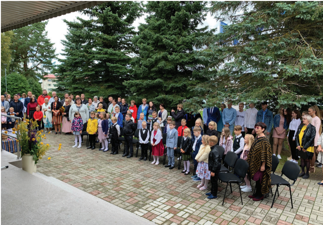
Kunda Ühisgümnaasiumi esimene klass.

Elanike arv seisuga 31.08.2020 on 5696 inimest.