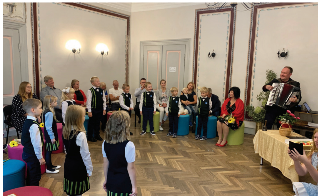
Vasta kooli esimene klass.

Uuendasime kooli õppekava tunniarvust plaani.