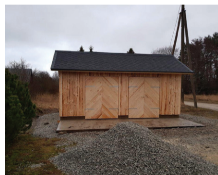
MTU Mahu Külaselts prügimaja.

Prügimajade ja prügikonteinerite platse rajamiseks loodud toetav meede on osutunud väga edukaks ning valda on ehitatud kahe aasta jooksul mitmeid uusi prügimaju ning -platse. See omakorda aitab kaasa jäätmeäitluse arengule ning valla üldpildi ilusamaks muutmisele. Hea meel on tõdeda, et huvi projekti vastu on olnud suur ning saada olev rahastus on igal aastal ära kasutatud täielikult. Selleks aastaks on rahalised vahendid toetuste andmiseks otsas, aga alates järgmise aasta jaanuarist võtame vastu uusi taotlusi ning kehtib endiselt põhimõte „kes ees, see mees“. Täpsemat info toetuse taotle-