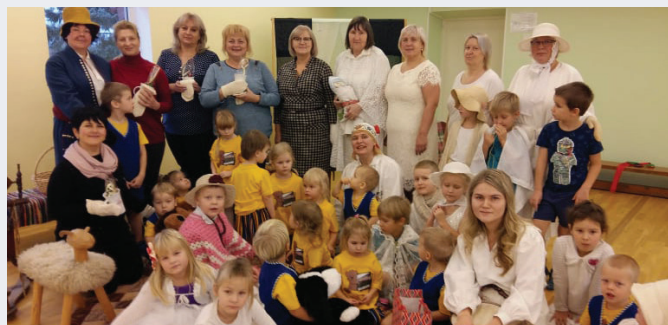
Moldova külalised koos Viru-Nigula kadridega.