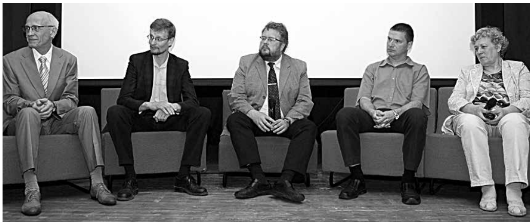
Keskkonnapäev kulmineerus paneeldiskussiooniga, kus arutleti klinkritolmu kasutamise võimaluste üle põllumajanduses.

Keskkonnapäeval esitati saalist Eesti Keskkonnanaurin-