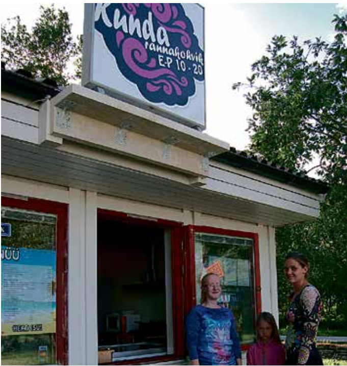
Kunda rannakohvik ja rand ootavad suvitajaid sööma ja rannamõnusi nautima.