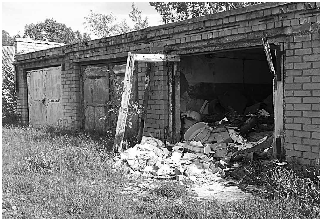
Prügihooldlaks muudetud garaaziboks Lähthal.

Kui lähiajal midagi ei muutu, siis kaalub linnavalitsus garaazide sundvõõrandamist, sest osade garaaziboksides ümbruses puudub omanikujärelevalve ning tõenäoliselt puudub ka soov midagi paremaks muuta. Kahjuks on linnas ka teisi kinnistuid, mille ümbruskond on heakorastamata – on ladestatud erinevaid jätmeid, hoonete ukseid ja aknad on lahti ning muru niitmata. Sel aastal oleme alustanud mitmeid menetlusi ja koostatud ettekirjutusi puuduste kõrvaldamiseks. Mõned kinnistuo- manikud on suutnud puudused likvideerida, osade tähtaeg puuduste kõrvaldamiseks on saabumas. Kui ettekirjutust ei täideta, siis linnavalitsusel tuleb rakendada sunniraha sissenõudmist ning tõenäoliselt alustada ka väärteomenetlust. Sunnirahaga sissenõutavad summad ei ole väikesed - näiteks jäätmeseaduse ettekirjutuse täitmata jätmise eest võib juriidilisele või füüsilisele isikule määrata sunniraha kuni 32 000 eurot ning lisaks karistada rahatrahviga. Seega on mõist-