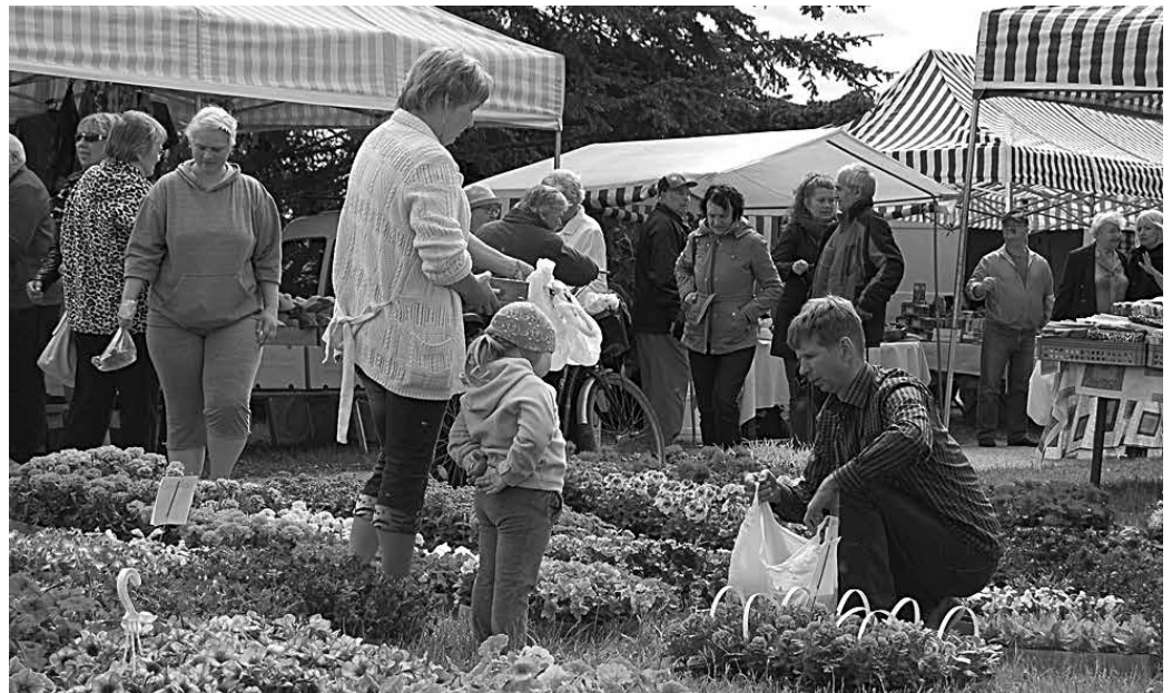
Linnapäeva raames toimus taaskord ka laad.

„Suurem muudatus võrreldes eelmise aastaga oli laada toimimine ning linnavalitsuse poolt korraldatud hommikukohvik. Olime küll ilmataadiga teinud kokkuleppe, et vihma ei saaks ja pool päeva nõnda oligi, kuid rongkäigu ajal hakkas sadama, kuid hiljem tuli jälle päike välja.