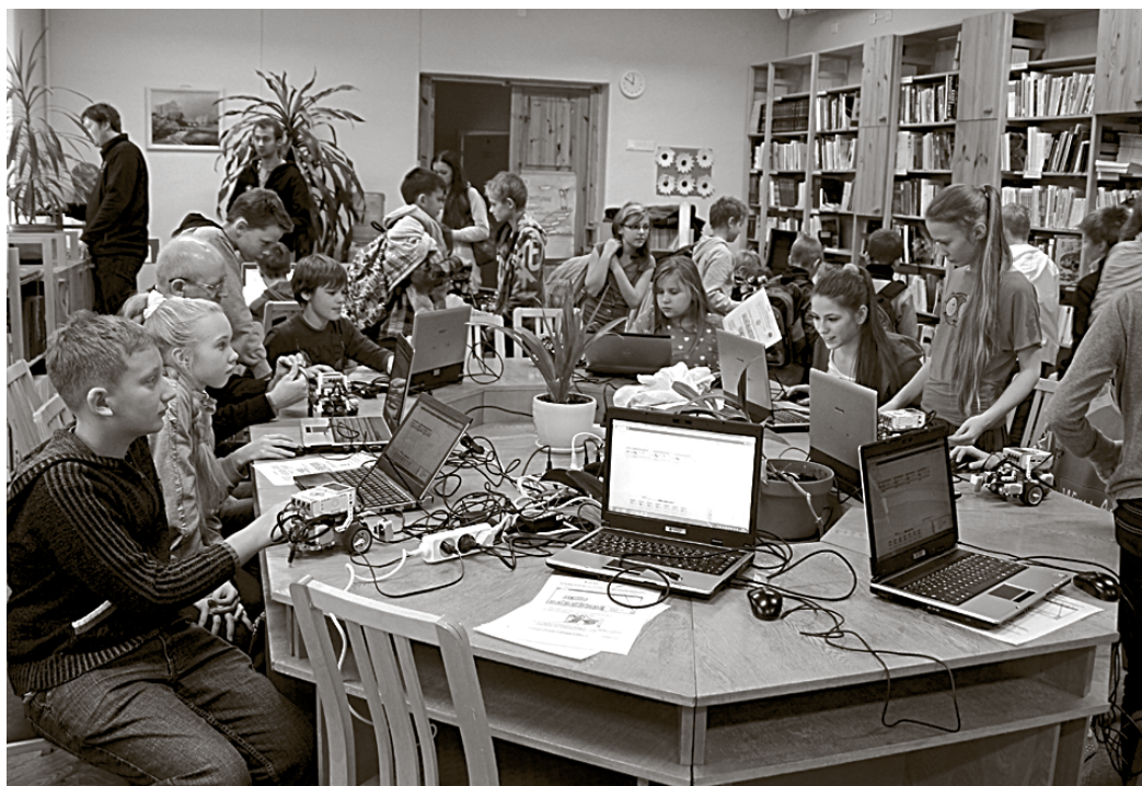
Jaanuarist käivitatud robotikaringist võttis kolme kuu jooksul osa ligi 30 õpilast.