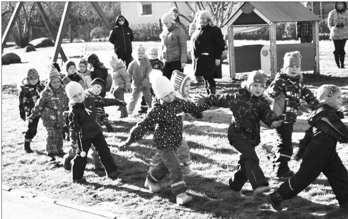
Подвижные игры - неотъемлемая часть воспитания ребенка.