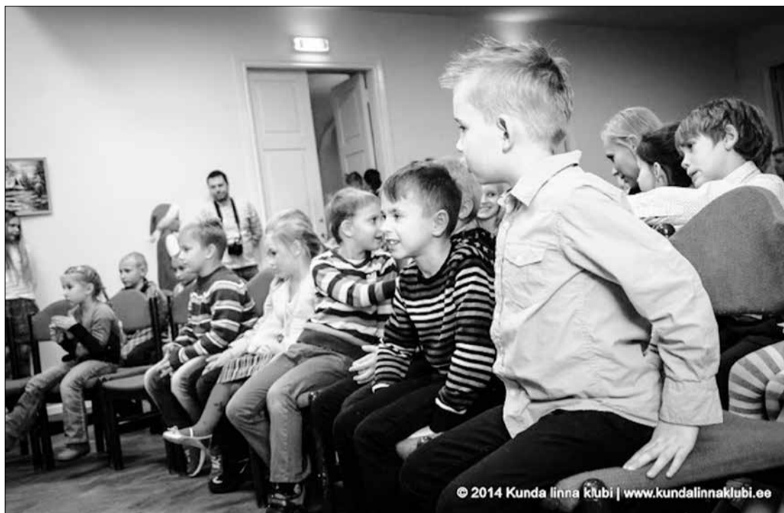
KNC поддерживает многие мероприятия, проводимые в клубе города Кунда.

Возобновится выплата пособия на погребение для семей с трудным материальным положением. Пособие на погребение будет выплачиваться семьям, организующим похороны и получившим за последние 12 месяцев хотя бы раз пособие по бедности. Размер пособия на погребение повысится до 250 евро. Пособие на погребение нельзя ходатайствовать, если смерть человека пришлось на 2014-ый год.