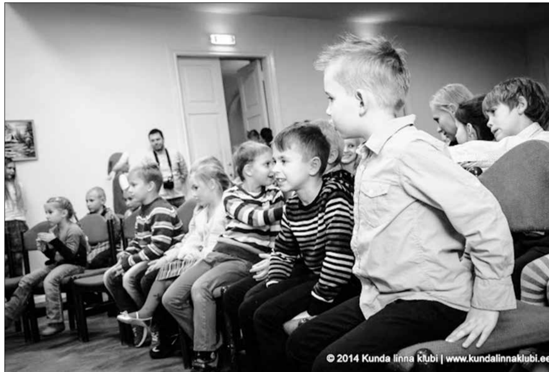
KNC toetab mitmeid Kunda klubi kultuuri- ja lasteüritusi.

Muutub ka riigilõivu tasumisel kasutatav viitenumber, milleks saab 2900082582.