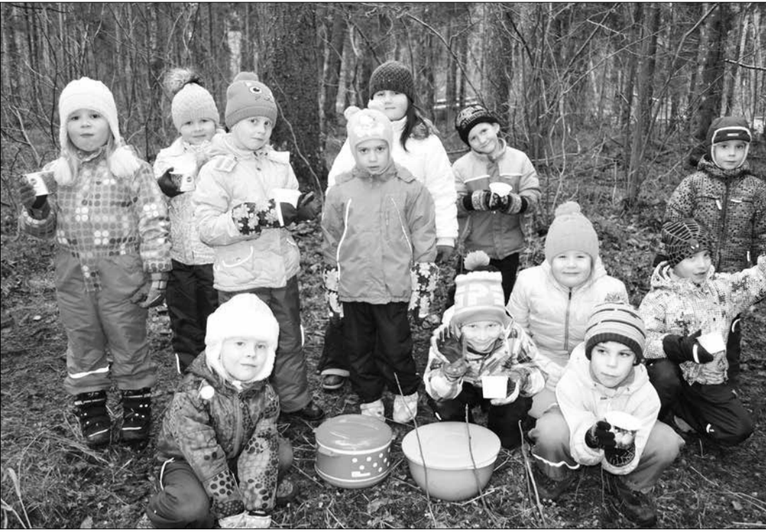
Loodusretked annavad lastele uusi teadmisi ja võimaluse aktiivselt liikuda.