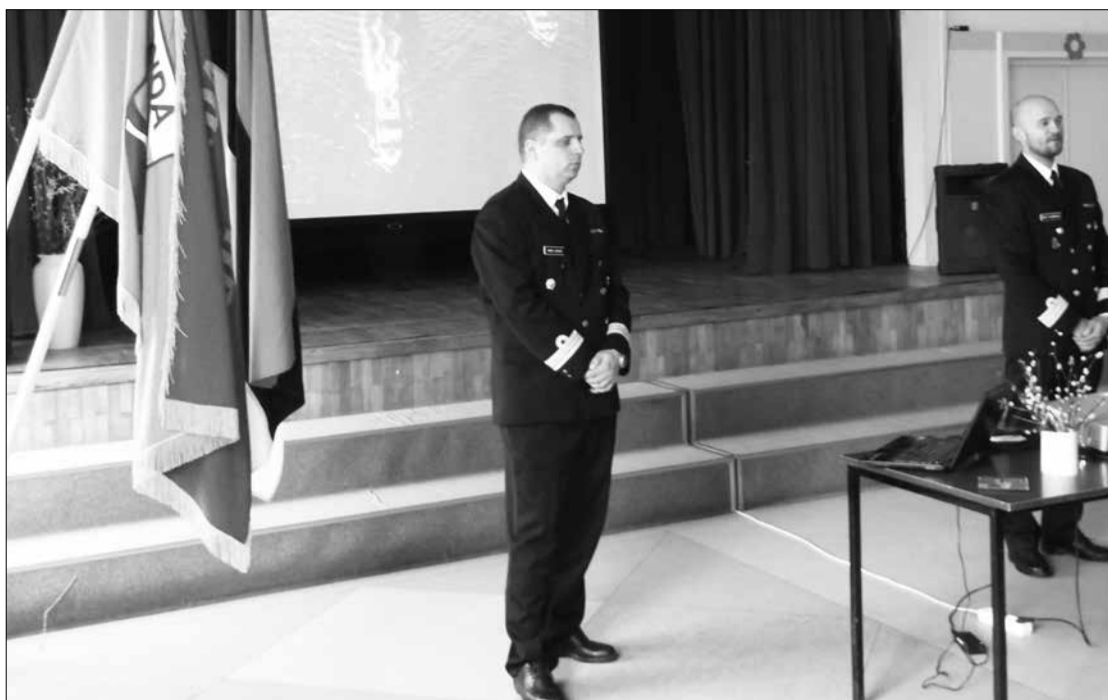
Офицеры корабля-побратима провели урок защиты Отечества.