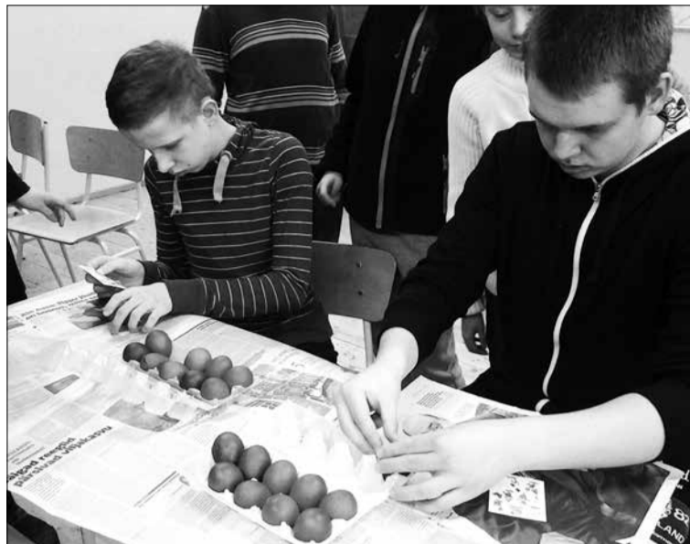
Встрече с пожилыми людьми предшествовала творческая подготовка.

ходить в этот дом. Там очень заботливые работники. Подарили им радость, и сам получишь радость обратно!»