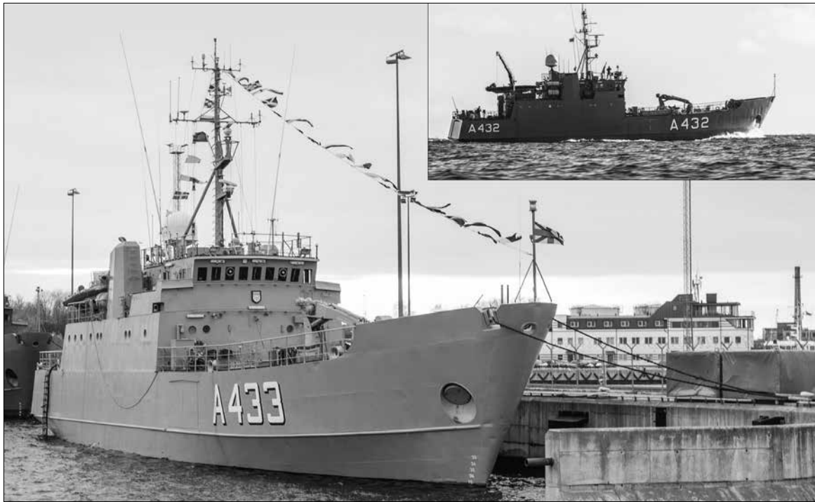
С 2006 года герб Кунда был на корабле Tasuja (A432). Теперь у нас новый корабль-побратим - Wambola (A433).