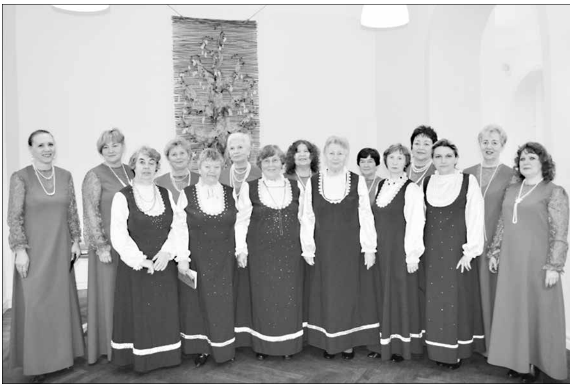
«Истоки» в парадном строю!