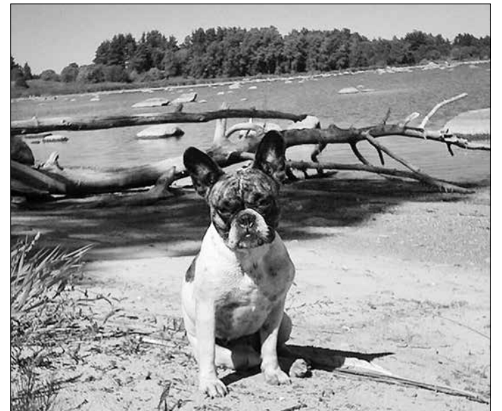
Фотография Теа Партс «Лицом к семье».

Конкурс снимков природы в гимназии проводится уже во второй раз. В прошлом году участвовало 25 снимков, и лучшую работу выбрала комиссия из пяти человек.