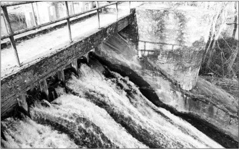
Такой увидела Кундаскую гидроэлектростанцию фотограф Катрин Йыггисаар с портала Bioneer.ee .