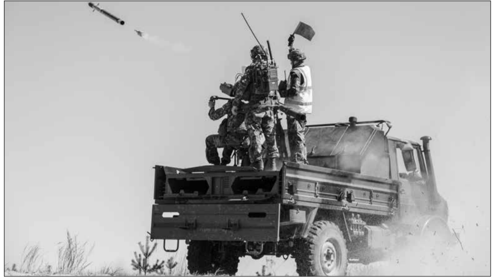
Kunda lähistel paukusid kuulsad raketikompleksid Mistral.

Osa harjutusi sooritatakse kaitseväge keskpõlvüooni kohal, kus kasutatakse ka lahingmoona. Õhuruumis, mis ulatub Aegviidust Kiviõlini ning Tamsalust mereni, näeb aeg-ajalt madallende. Viimaks korduvaid ülendele, püüab õhuvägi hajutada madallendude lennumarsruute. Madallennud toimuvad ohutus kõrguses, mitte madalamal kui 152 meetrit (500 jalga) ja eelisatavalt asustatud punktidest eemal. Madallennu harjutused on kooskõlas Eesti seadustega ning neid sooritatakse kokkuleppel Lennuameti ja