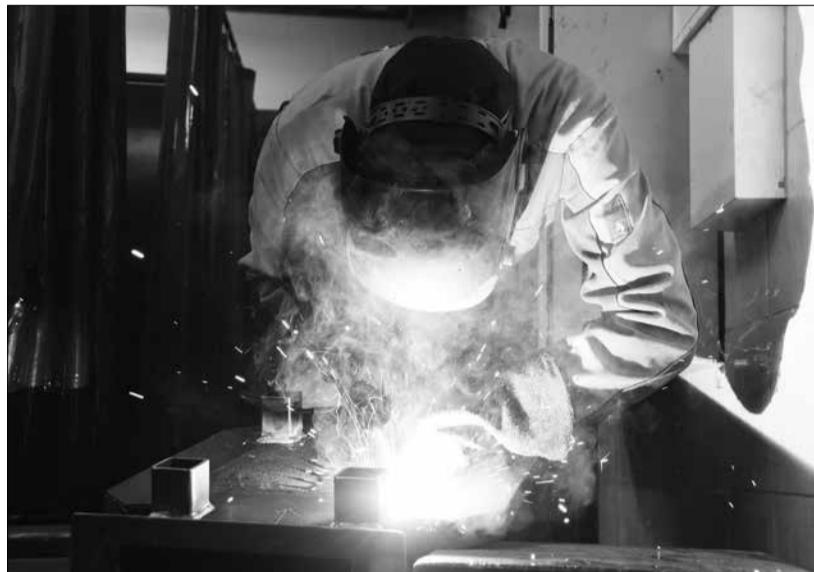
Rakvere ametikoolis õpib ligikaudu 750 õpilast erinevatest Eesti maakondadest.

Kõige raskem on muukeelsete õpilaste hinnangul sisseelamise periood. Siis ei tunta veel klassikaaslast, ei teata, kelle poole abi saamiseks pöörduda. Kõik kinnitavad ühest suust, et sel perioodil stressi on, aga see läheb ruttu mööda. Hea, kui kursusel on