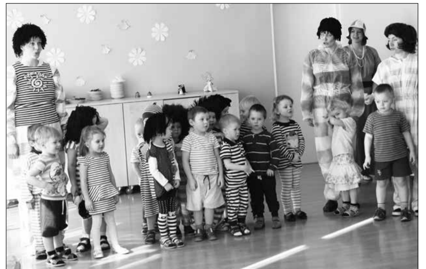
Vahest oleme kõik triibulised – suured ja väikesed.