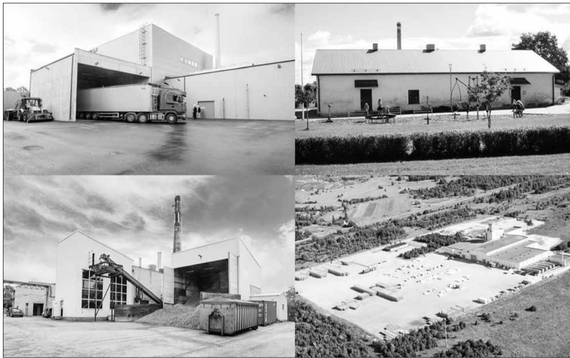
Объекты Adven Eesti в Раквере, Пыльтсамаа, Кунда и Андыя.

Концерт завершился общей импровизацией на ритмических инструментах, в которую привлекли всех присутствующих. Из маленького кусочка мелодии на разных инструментах в итоге получилась интересная составляющая звука и ритма, которую потом в шутку предлагали назвать «Симман в честь Женского дня».