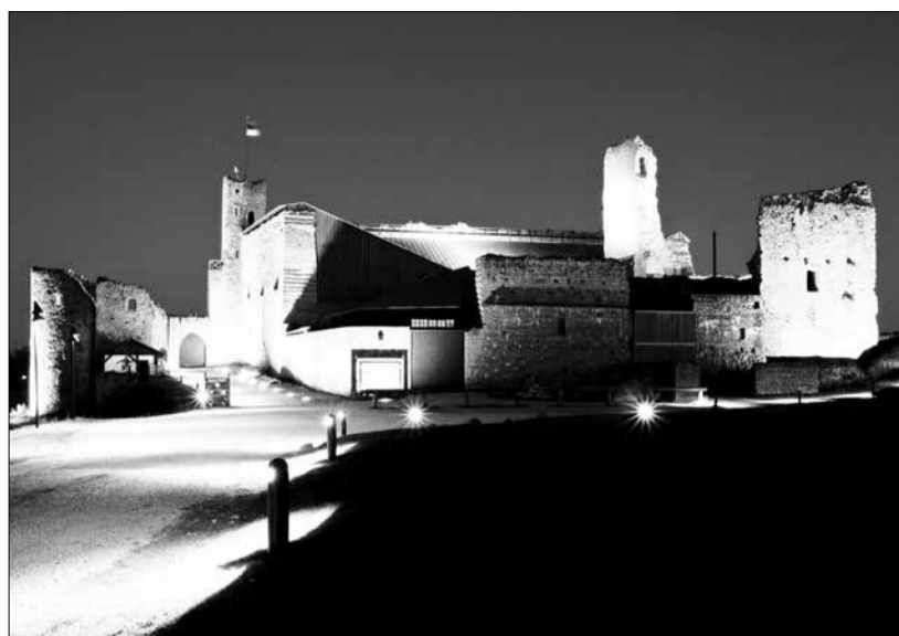
Раквереская крепость. Лучшая работа уездного фотоконкурса 2015 года.

Члены семьи лица, нуждающегося в помощи, или люди, знающие о проблеме, должны сообщить о лице, нуждающемся в помощи, чтобы вместе найти разумное решение.