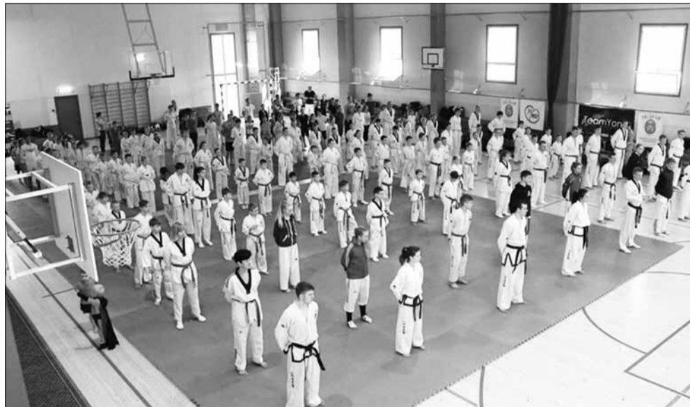
Массовый день тренировки в истории тхэквондо Эстонии проводился впервые.