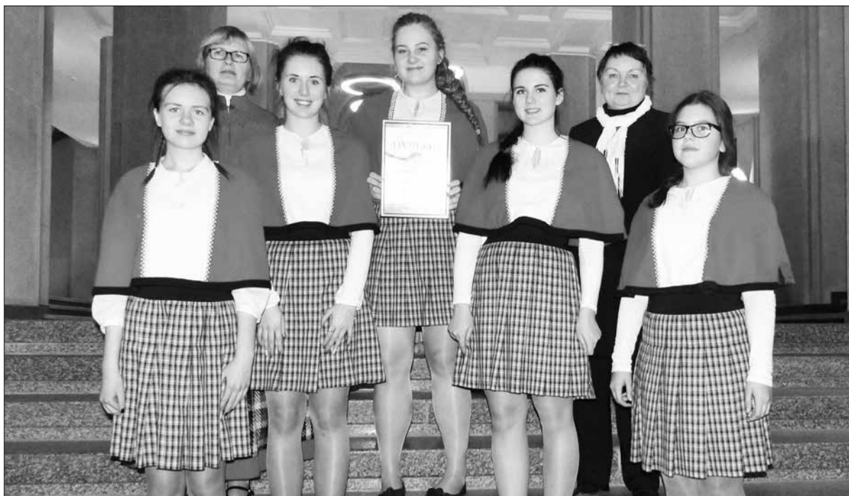
Наши участницы Вирумааского хора девушек в польском Гданьске.