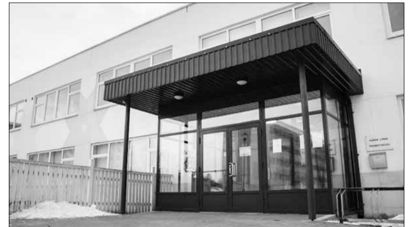
Дорогу в городскую библиотеку знает каждый житель Кунда.

Один из участников опроса выразил переживания по поводу того, что к нам поступают