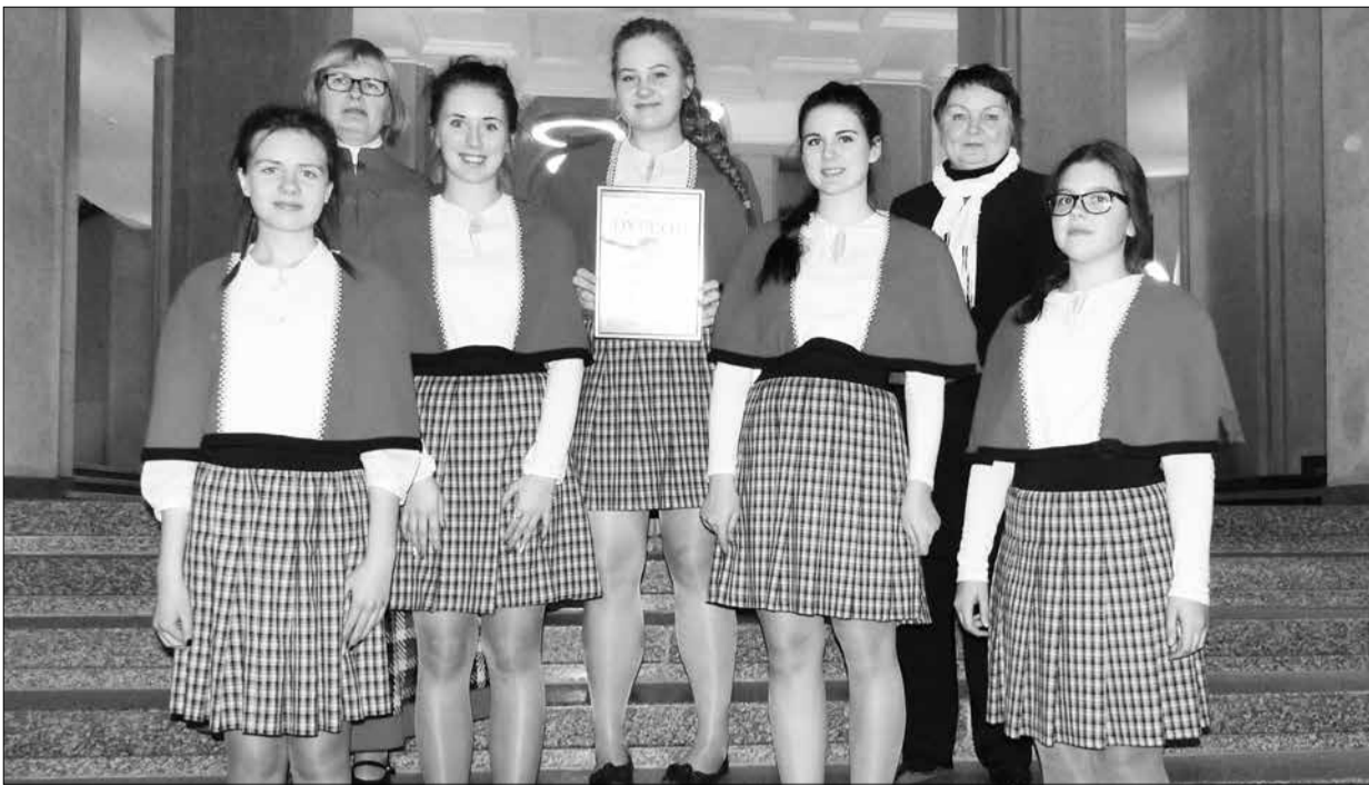
Kunda tublid laulutüdrukud Poola koorifestivalil.