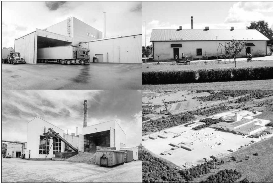
Adven Eesti objektid Rakveres, Põltsamaal, Kundas ja Andjas.

Loodetavasti innustab selline vabas ja rõõmsas õhkkonnas omaloomingupäev õpilasi julgelt heliloomingu tegelema.