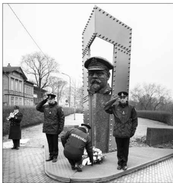
Mereväe baasi aastapäeva tähistamine. 01.04.2016

Mereväe laevastiku hulka kuulub neli sõjalaeva, kellel kõigil on sõlmitud sõpruslepingud mõne Eesti linnaga. Mereväe lipulaev miinijahtija Admiral Cowani sõpruslinnaks on Kuressaare, miinijahtija Sakala sõpruslinnaks on Viljandi, miinijahtija Ugandi sõpruslinnaks on Otepää ning tuukri- ja toetuslae-