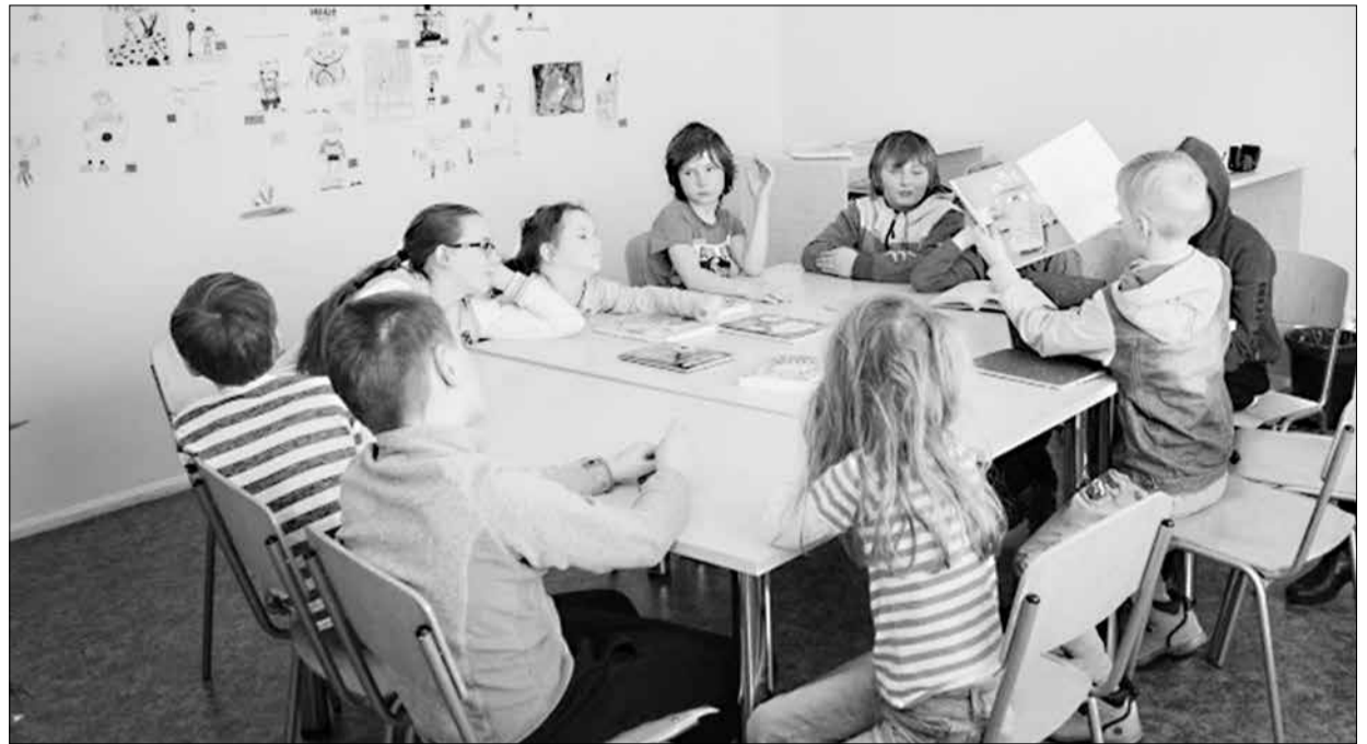
Raamatukogu üheks töösuunaks on töö lastega.