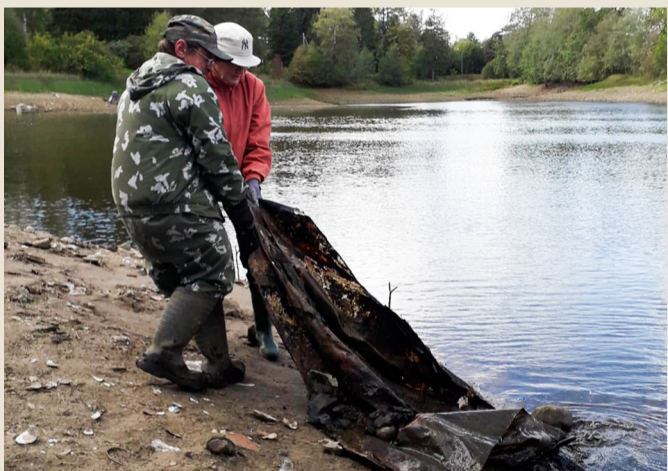
Aseri tiigi koristamine.

Kui lugesin konkursikuulutust vallakantselei juhi ametikohale, siis ega pikalt ei mõelnud. Väljakutse tundus huvitav. Tullis ühest suuremast Eesti omavalitsusest (valdade mõistes), siis maailmade põrkumine on olemas ja see ongi selle kõige juures huvitav. Vallakantselei juhina on minu eesmärgiks tagada kiire ja efektiivne asjaajamine, kiidusõnu saav klienditeenindus ja meie töö avalikkus. Suurem osa tööst on majasisene töökorraldus, lisaks vallavalitsuse personalitöö juhtimine. Minu suurim soov on oma teadmisi Viru-Nigula vallas kõige paremal moel rakendada. Mõtteid ning ideid on palju, hetkel tuleb olukord ära kaardistada ja siis tegutsema hakata.