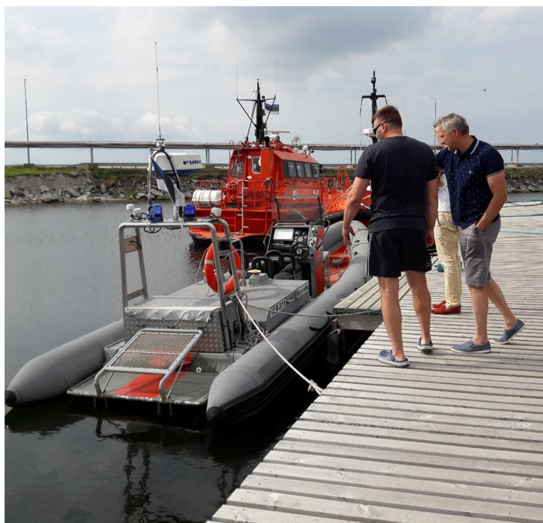
Kunda merepäästjad 2017. aasta suvel.

Eelmisest teemast kasvab välja ka supluskohtade teema, mis inimestele palju korda läks ja mille osas küsitluses palju ettepanekuid tehti. Tegelikult käiakse ujumas eelkõige kodulähedastes ja privaatsemates randades. Küsitluses olid nimetatud rannad, millel võiks olla piirkondlik ja