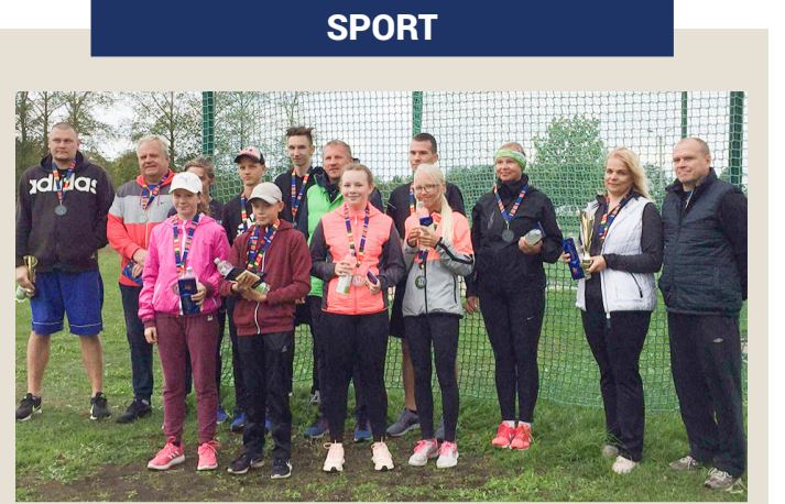
Adolf Noormetsa mälestusvõistlus.