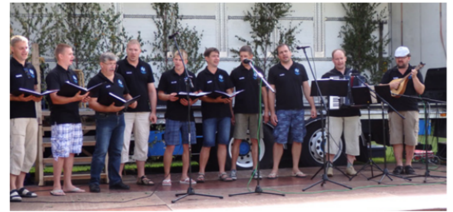
VN мужчины в Карвиа