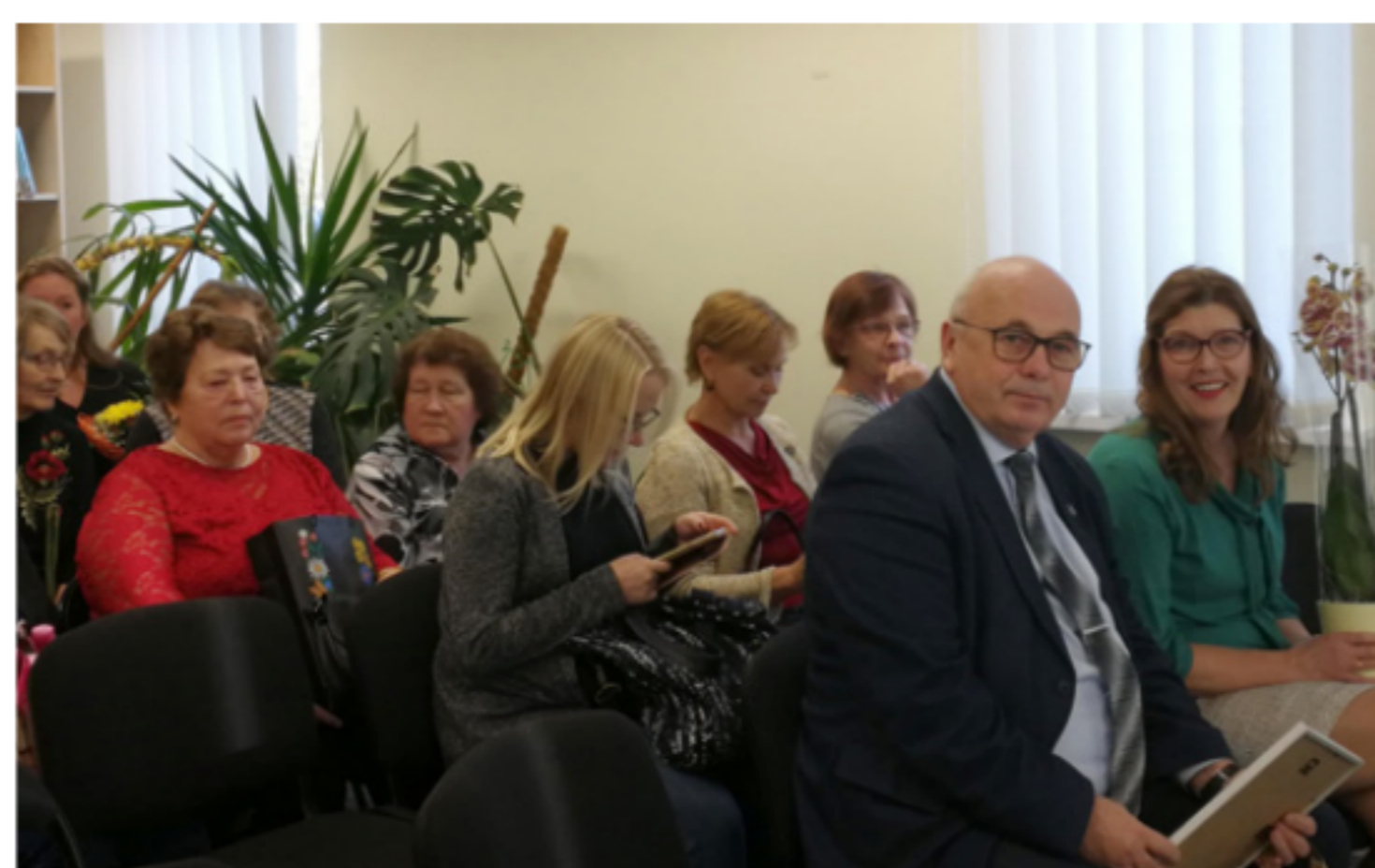
110-летний юбилей библиотеки.

В 1924 году после принятия закона о Публичных библиотеках в Виру-Нигула стала