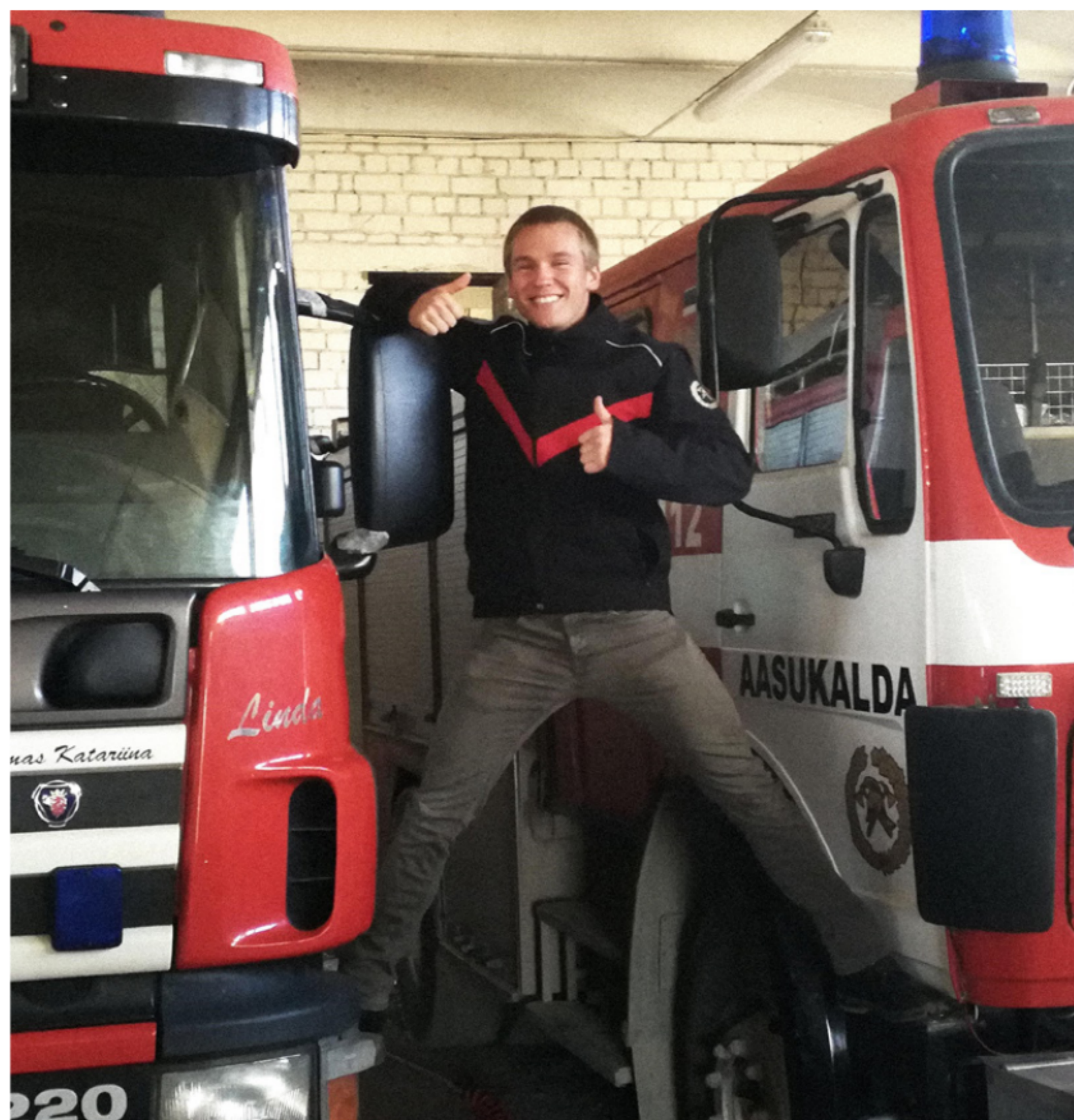
путник из Асукалда