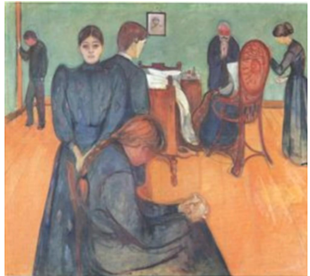
Surm haigetoas. 1893

1889. a oli esimene personaalnäitus Oslos. Ta hakkas saama kunstistipendiumi. Käis neli kuud Leon Bonnat'i kunstikoolis Pariisis. 1890. a reisis Saksamaale, Prantsusmaale, Itaaliasse. Ringi sõites olid tal alati kaasas vanad kirjad tädi