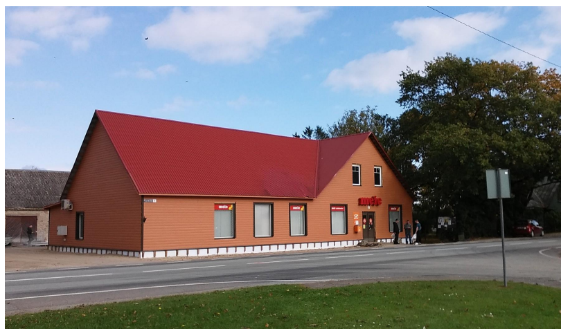
Tekst ja foto: Marit Laast

Viru-Nigula kauplusehoone renoveerimistööd plaanitakse lõpetada oktoobri esimeses pooles.