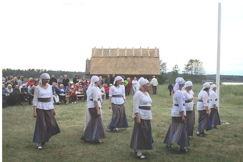
Foto on küll meie viimasest jaanitulest Mahu rannas, aga vahelepõikena olgu öeldud, et viimasel ajal on jaanidest umbes veerand kuivad olnud, ülejäänud on vihmased ja jahedad. Kuivad jaanid olid 1971, 1978, 1989, 2009, 2013. H. Tarjan

Rahvakalendis oli heinamaarjapäeva üks uskumusi mitte sel päeval heina teha. Kui tegid, võis pikne kuhja põlema panna.