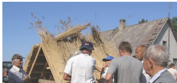
Fotomeenus eelmisest pilliroofestivalist Mahus

Korraldatakse õpetlik ja romantiline rooret, mille käigus külastatakse giidi juhatusel Mahu küla talusid, matkatakse läbi hooldatud ja hooldamata rannaniitude, võsastunud ja roogu kasvanud kaldaalade kuni Venetsaare neeme tipuni, kust naastakse paatidel sadamasse, et jätkata külaplatsil festivalitegevustega. Rännaku radiaali pikkus on ca 4 km ja annab osalejatele pildi inimese osast